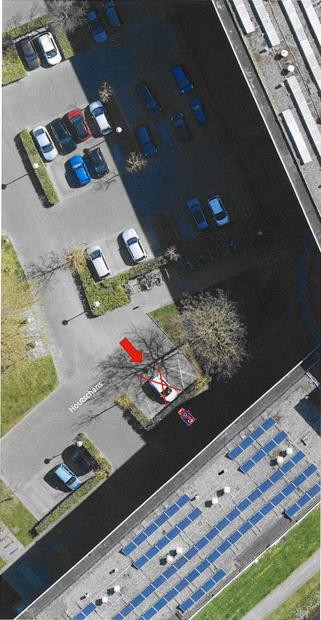
Tekening behorend bij verkeersbesluit opheffen gereserveerde gehandicaptenparkeerplaats aan de Houtschans, Z/26/194657/453778