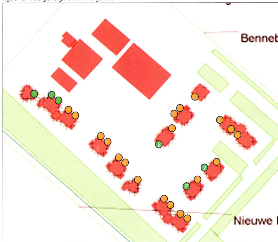
Figuur 1 Weergave geluidsluwe gevels

In het kader van de goede ruimtelijke ordening hanteren wij het uitgangspunt van de aanwezigheid van minimaal één geluidsluwe gevel per woning. Een geluidsluwe gevel houdt in dat het geluidsniveau op deze gevel 48 dB of lager is. De woningen in het plangebied voldoen (inclusief de uitzonderingsregel dat 15% niet hoeft te voldoen aan de geluidsluwe gevel en de maximale gecumuleerde waarde) aan deze gemeentelijke akoestische randvoorwaarden. Om aan de maximale 15% afwijking te kunnen voldoen volstaat het om bij de drie woningen voorzien van een de ruimten op de zolderverdieping als onbenoemde ruimten te bestemmen (zie figuur 1 hieronder).