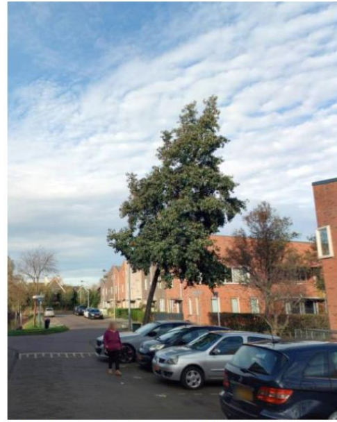
Afbeelding 2: foto van de boom uit 2025

Op de foto's is goed te zien dat de boom tussen 2022 en 2025 duidelijk schuiner is gaan staan. Waar de boom in 2022 nog redelijk recht omhoog groeide, helt hij in 2025 duidelijk meer richting de huizen. Deze verandering in stand valt op wanneer je de twee beelden naast elkaar bekijkt.