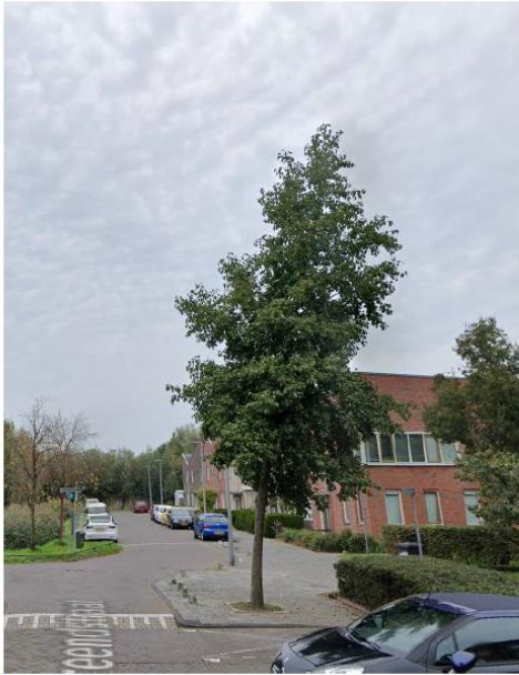
Afbeelding 1: Foto van de boom uit 2022