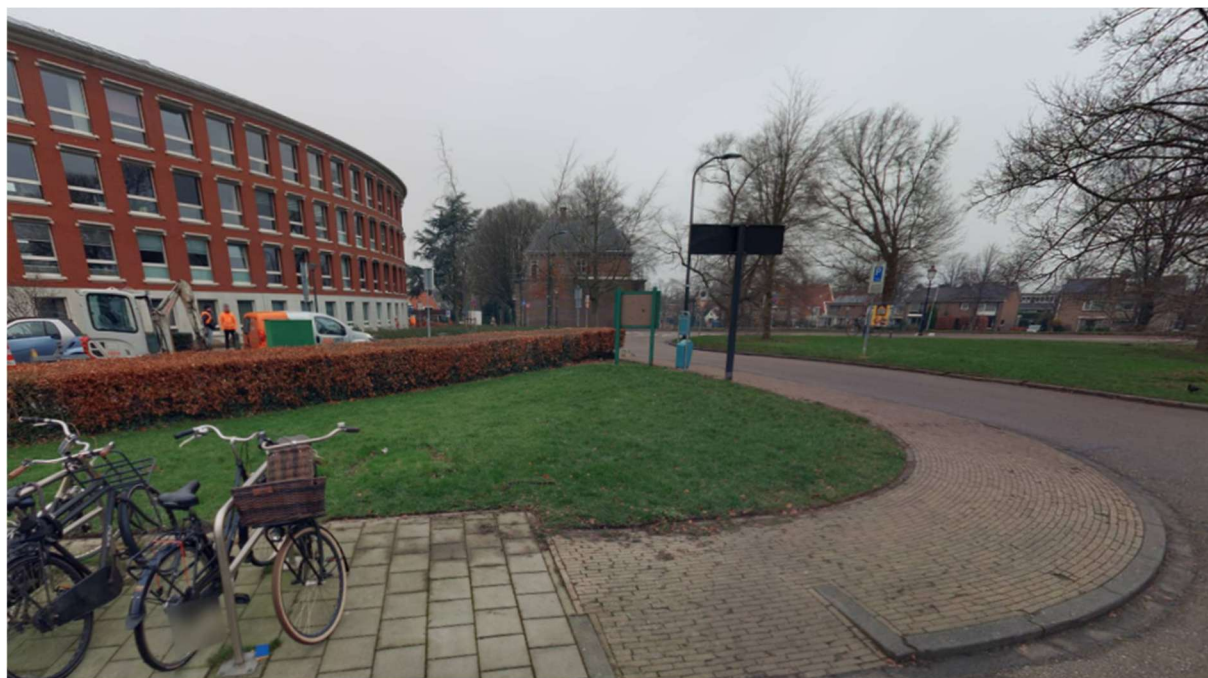
Figuur 2 Locatie 80283G-1

Locatie 80283G komt te vervallen en wordt vervangen door locatie 80283G-1. De locatie 80283G-1 komt verder van de bestaande bebouwing af te liggen. Zie figuur 2.