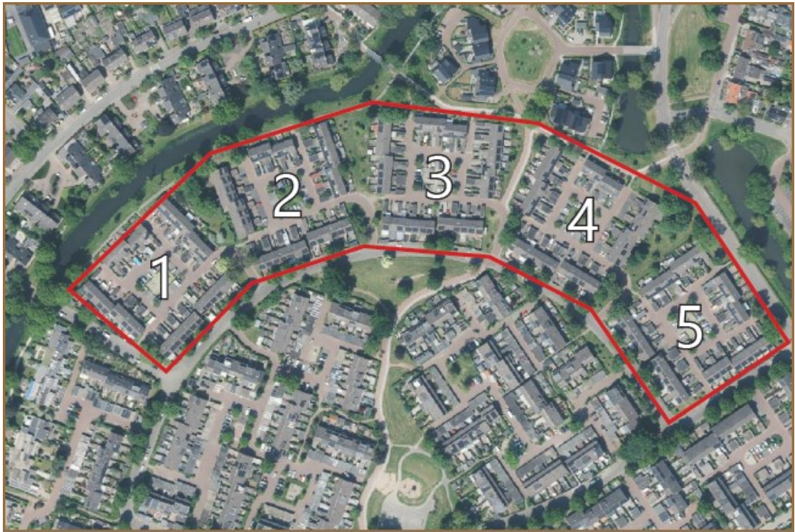
Figuur 1 plangebied valkhof te Barneveld