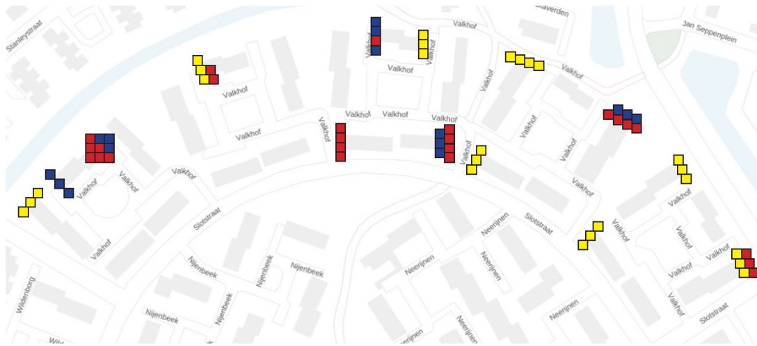
Figuur 2: Kaart van De Valkhof met daarop de nieuwe aan te brengen en in te bouwen voorzieningen aangegeven. In rood inbouwkasten voor vleermuizen, in donkerblauw inbouwkasten voor gierzwaluwen en in geel tijdelijke nestkasten voor huismus.