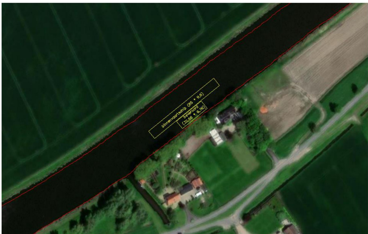
Figuur 1a: Situatie met baggerwerkzaamheden met ponton en CEMT IV-schip (vrij ruimte vaargeul: halve vaargeul)

In onderstaand figuren is op een tweetal locaties de situatie weergegeven waarbij aan linker of de rechterzijde van het kanaal baggerwerkzaamheden worden uitgevoerd. Het scheepvaartverkeer moet ter hoogte van de baggerwerkzaamheden manoeuvreren naar de andere zijde van het kanaal om de baggerwerkzaamheden te passeren. Tijdens de baggerwerkzaamheden is de vaargeul voor circa 50 % versperd door het ponton en het naastliggende binnenvaartschip.