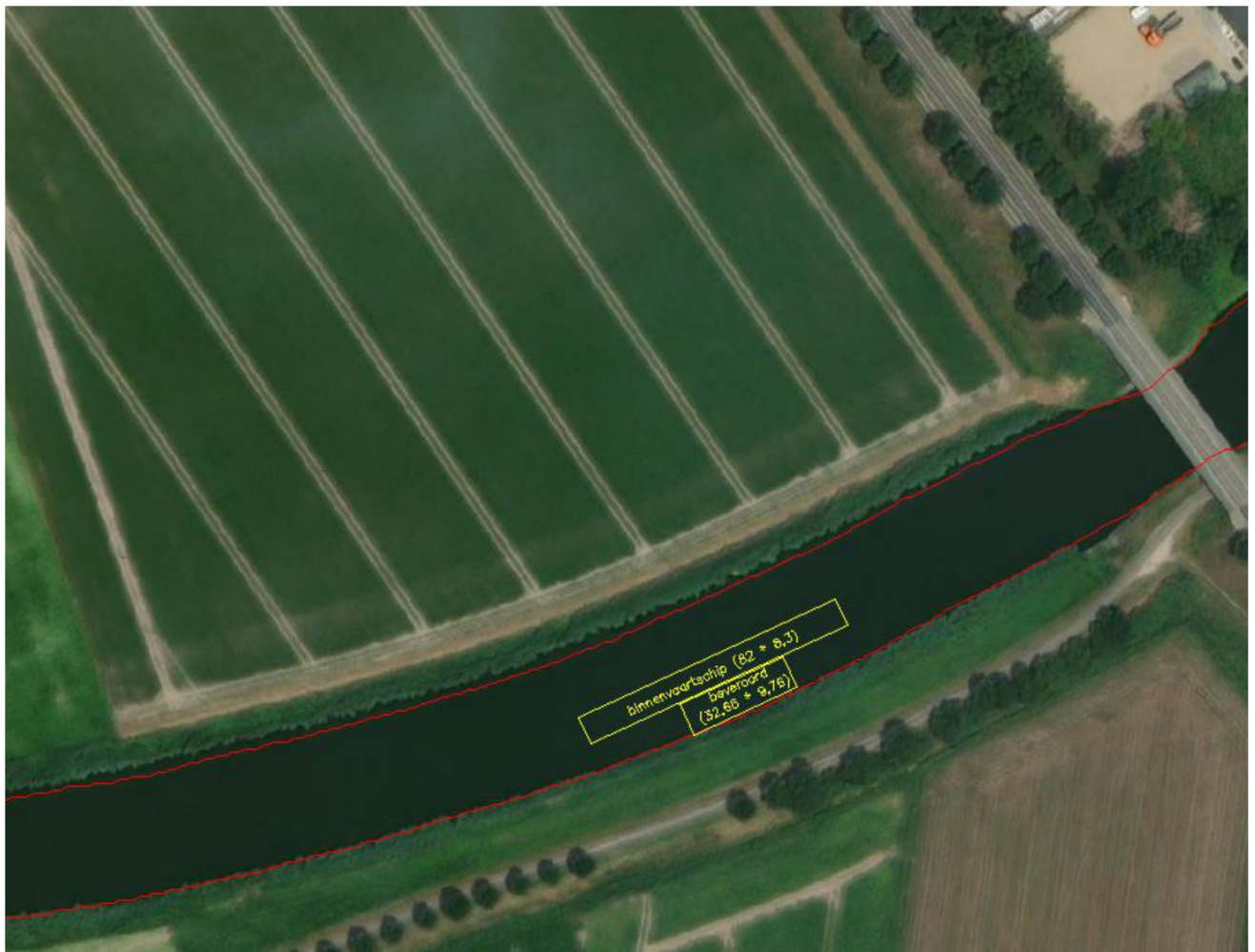
Figuur 1b: Situatie met baggerwerkzaamheden met ponton en CEMT III-schip (vrij ruimte vaargeul: halve vaargeul)

Ter verduidelijking is in figuur 2 een dwarsprofiel weergegeven met hierin de ligging inzichtelijk gemaakt van het baggerponton met een naastgelegen schip. Zoals in de figuur is te zien, is circa de halve vaarweg als werkruimte benodigd.