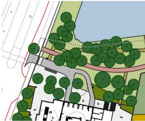
Fig. 1 Stedenbouwkundigplan t.p.v. K.P. van der Mandelelaan

Op het Brainpark in Rotterdam gaat herontwikkeling plaatsvinden. Aan de Max Euwelaan en de K.P. van der Mandelelaan liggen percelen waar nu kantoorpanden staan. Op deze locatie worden woontorens gebouwd, waarmee 749 appartementen worden gerealiseerd. Ook wordt hiervoor het wegenplan aangepast (zie fig. 1). Ten behoeve van deze ontwikkeling moeten bestaande bomen worden gekapt of verplaatst.