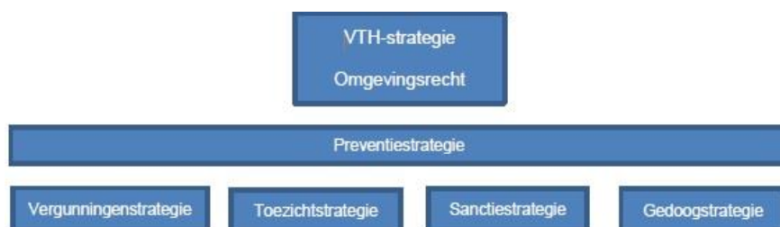
Figuur 3: onderlinge verhouding strategieën

De sanctiestrategie en gedoogstrategie maken onderdeel uit van de Landelijke Handhavingstrategie (LHS). Ondertussen zijn er ontwikkelingen gaande, zoals het opleveren van een geactualiseerde (LHS) en een Landelijke Vergunningenstrategie. De uitkomsten hiervan worden betrokken bij de doorontwikkeling van deze U&H-strategie.