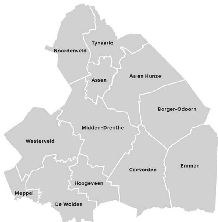
Figuur 2: Overzicht van het werkgebied van de RUD Drenthe

Drenthe is geweldig! Het prachtige landschap en de rijke geschiedenis wordt door veel mensen enorm gewaardeerd. In Drenthe is er nog rust, het Dwingelderveld is in 2020 niet voor niets verkozen tot het stilste gebied van Nederland. Naast rust zijn er in Drenthe ook een aantal bijzondere bedrijven te vinden zoals: Astron in Dwingeloo, Wildlands Adventure Zoo in Emmen en het TT-Circuit in Assen. Meer dan 95% van de het Drentse bedrijfsleven behoort tot het MKB. Binnen de overige bedrijven is agrarische sector het sterkst vertegenwoordigd, gevolgd door de recreatieve sector. Zware industrie bevindt zich op het Getec Park in Emmen. Hier hebben zich onder andere bedrijfstakken van DSM en Teijn Aramid gevestigd.