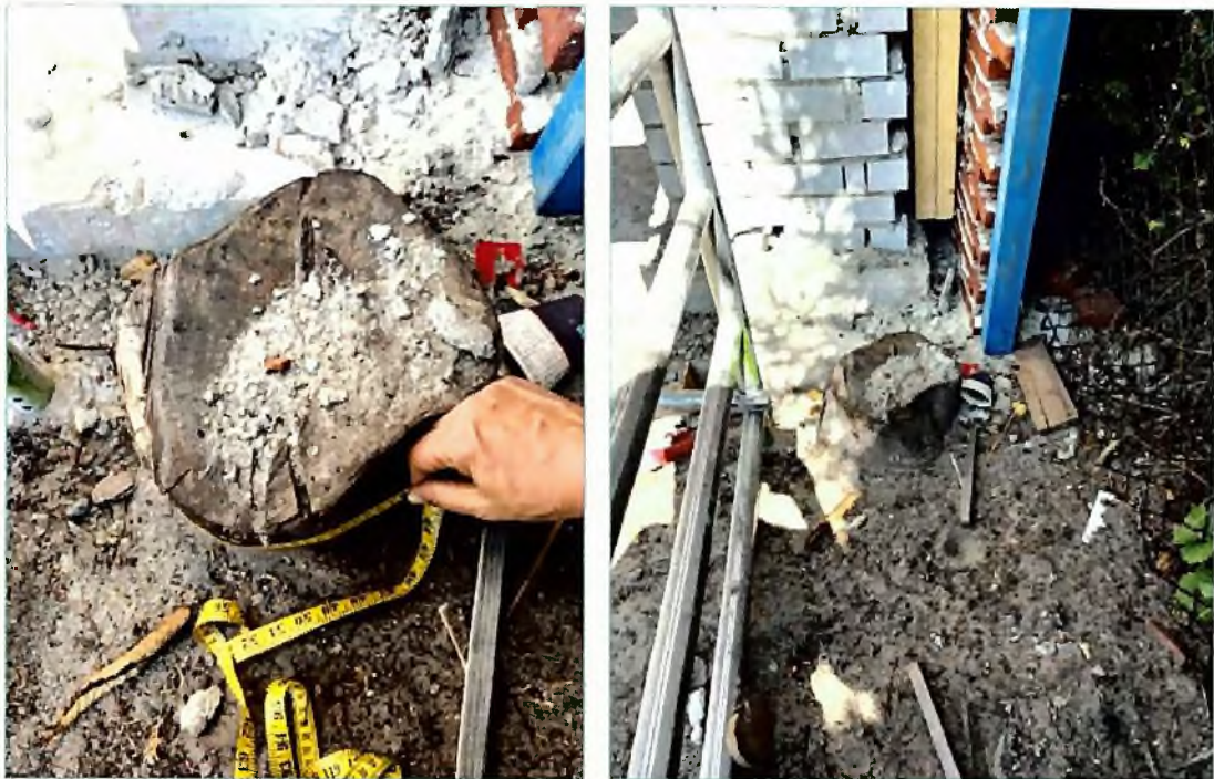
Afbeelding 2, constatering verwijderde boom Bron: Gemeente Eindhoven, zie bijlage E