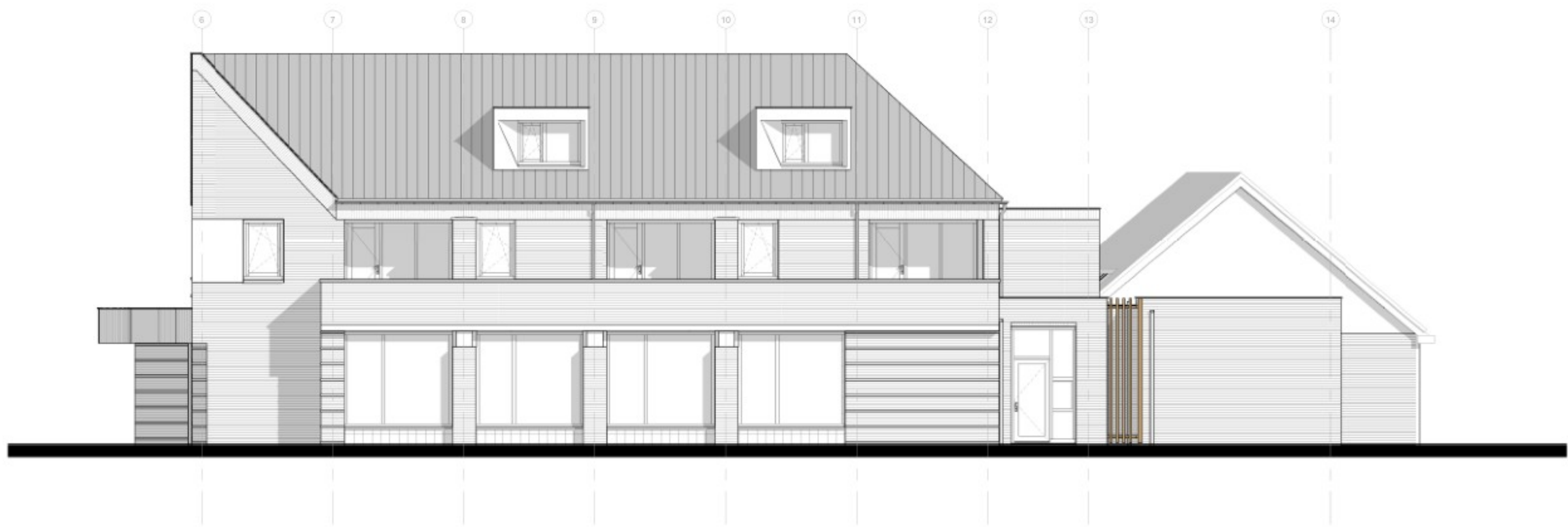
Voorgevel (straatbeeld Zeilbergsestraat)