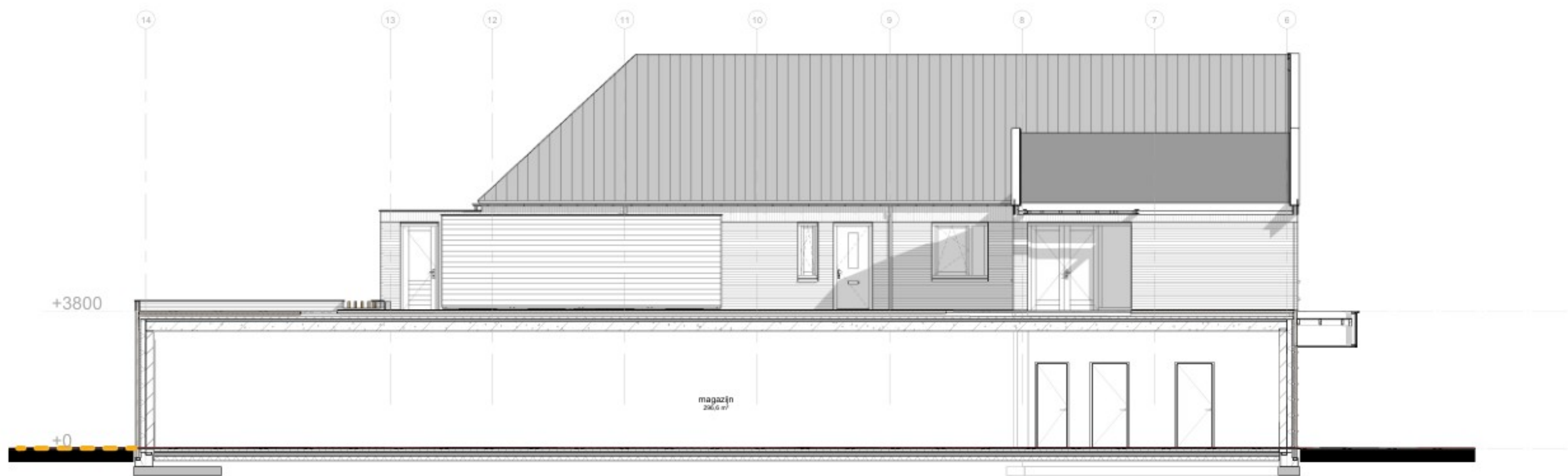
Achtergevel (aanzicht gevels appartementen)