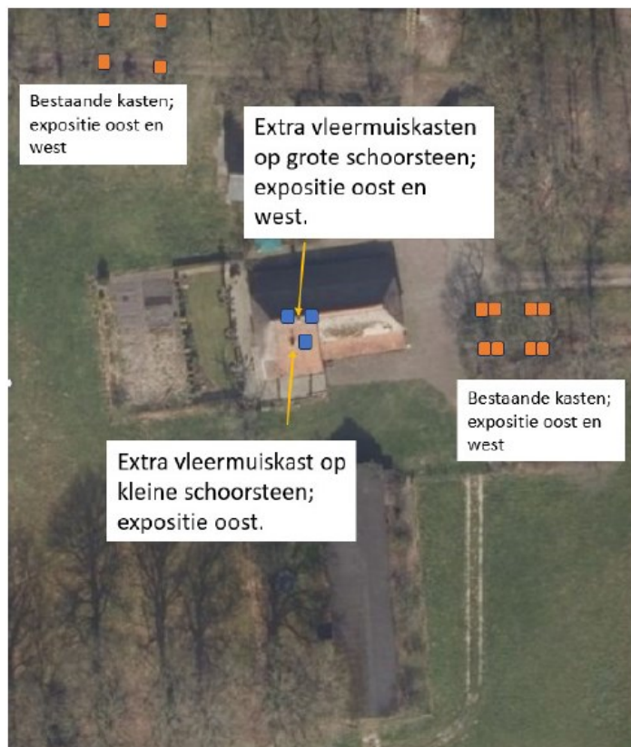
Figuur 1 Luchtfoto van het plangebied met de tijdelijke vleermuiskasten aan bomen (type Schwegler 3FF of vergelijkbaar) aangegeven met oranje vierkantjes. Ook staan hierop 3 tijdelijke vleermuiskast aan de schoorsteen van de boerderij (type VMT1 van Unitura of vergelijkbaar) aangegeven met blauwe vierkantjes.