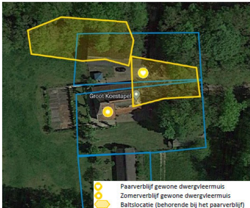
Figuur 4 Luchtfoto van het plangebied en omgeving met de resultaten van het onderzoek van seizoen 2022 – 2023. De gebouwen en omgeving zijn aangegeven met blauw.