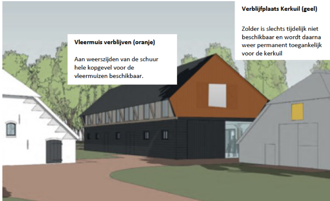
Figuur 1 Impressie van de schaapskooi en rundveestal na de werkzaamheden. In oranje is de kopgevel die beschikbaar wordt gesteld voor de gewone dwergvleermuis aangegeven. Met geel is de huidige verblijfplaats van de kerkuil aangegeven, deze verblijfplaats komt na de werkzaamheden weer beschikbaar.