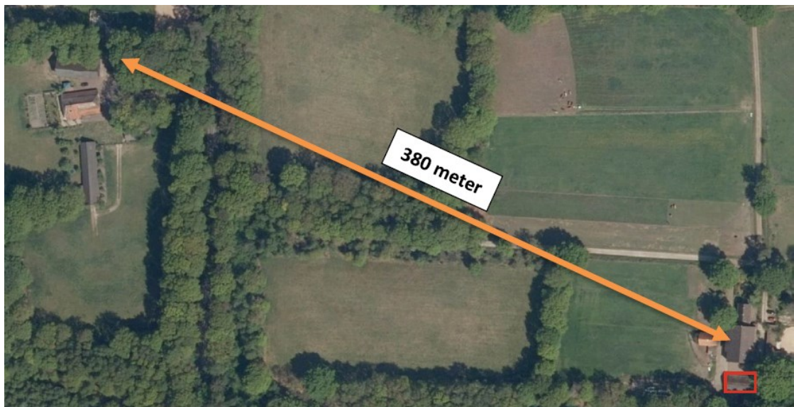
Figuur 2 Luchtfoto met links het plangebied en rechts (rood vierkant) de locatie van de alternatieve verblijfplaatsen.