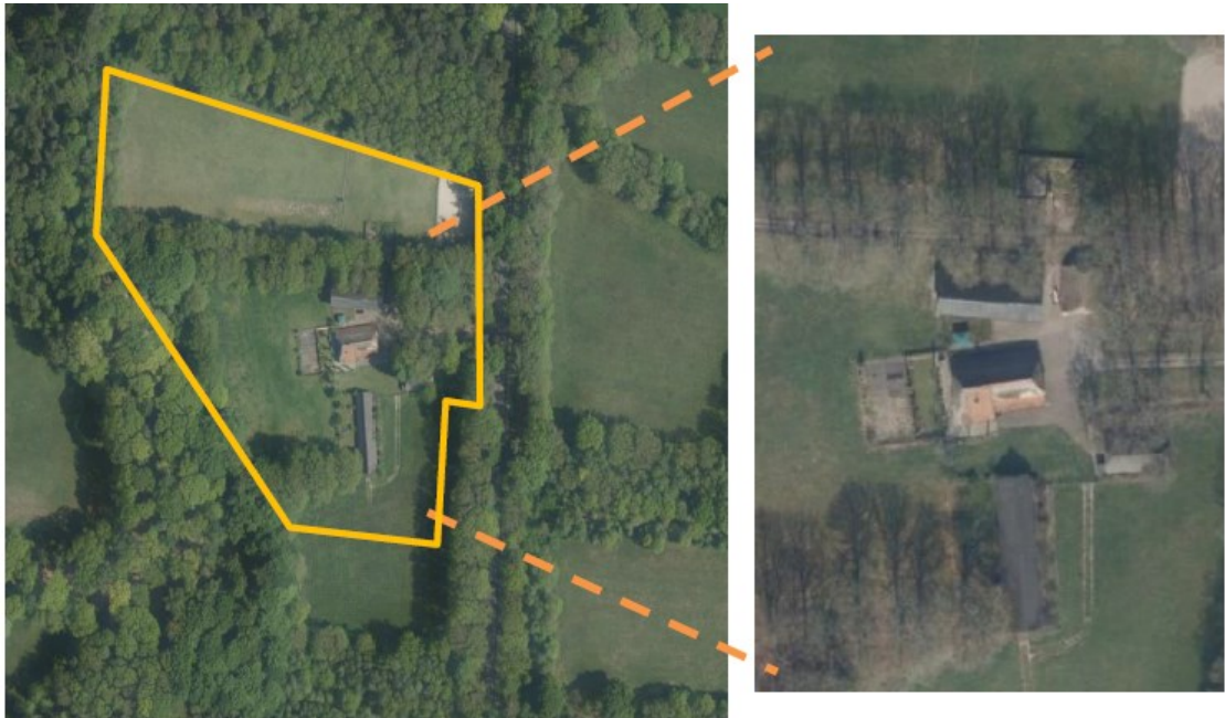
Figuur 1 Luchtfoto van het plangebied (geel omlijnd) met een ingezoomde foto van de gebouwen.