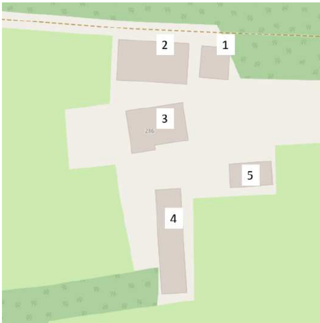
Figuur 2 Kaart van het plangebied met alle gebouwen genummerd. 1) Oude schaapskooi, 2) Voormalige rundveestal, 3) Woonboerderij, 4) Oude varkensstal, 5) Schuurtje.