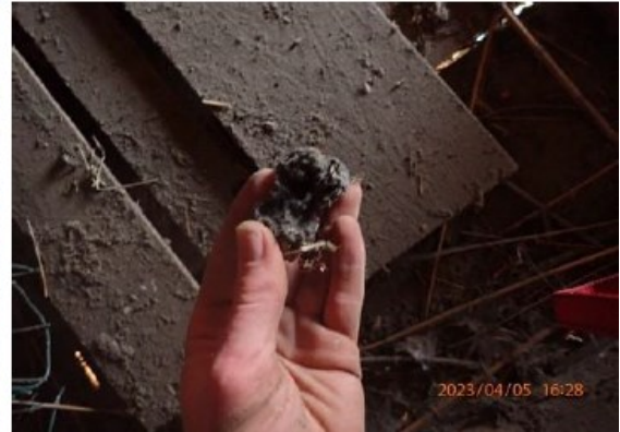
Figuur 7 Foto van een dwarsbalk met sporen van ontlasting (links) en een foto van een braakbal op de zoldervloer (rechts).