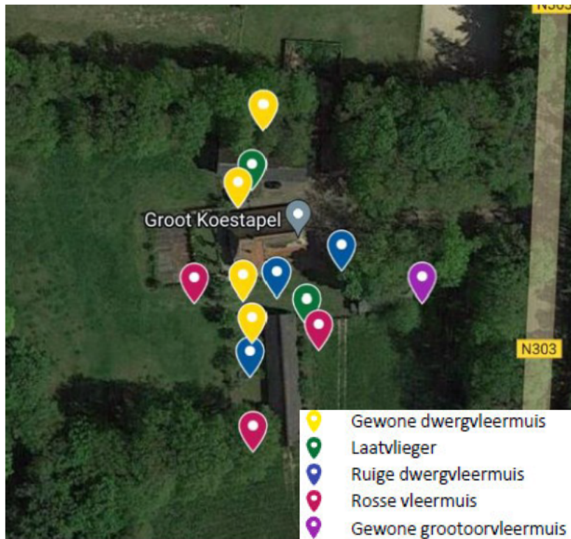
Figuur 5 Luchtfoto van het plangebied en omgeving met de resultaten van het onderzoek van seizoen 2022 – 2023.