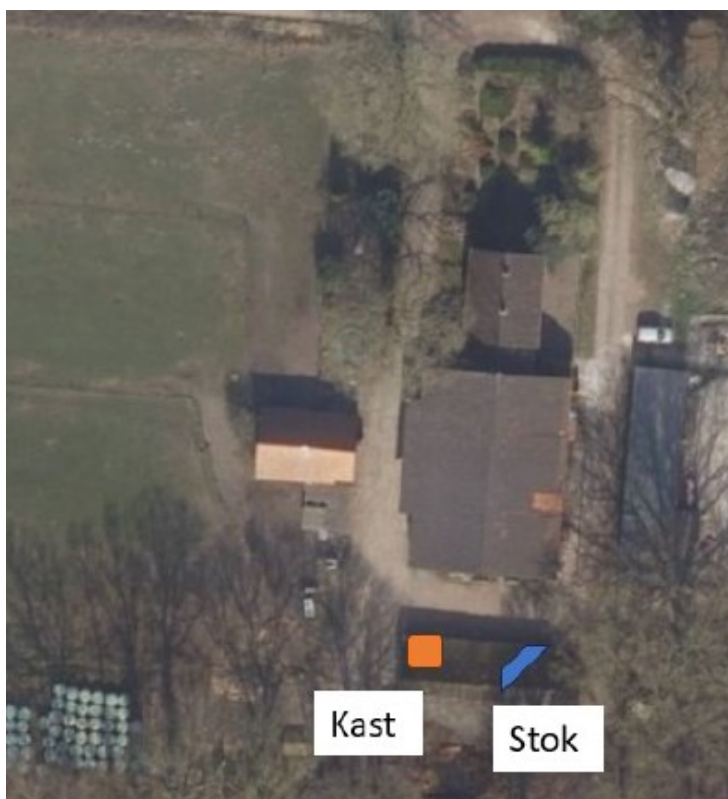
Figuur 3 Luchtfoto van de locatie van de alternatieve verblijfplaats. In oranje is de locatie van de nestkast aangegeven en met blauw is de locatie van de zitstok aangegeven. De nestkast wordt gemaakt volgens de omschrijving in het kennisdocument van Bij12.