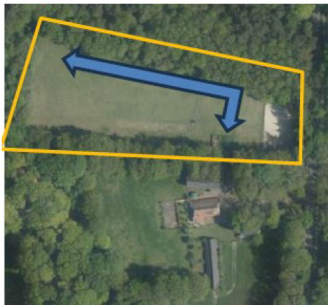
Figuur 6 Luchtfoto van het plangebied en omgeving met de resultaten van het onderzoek van seizoen 2022 – 2023. In geel is het onderzoeksgebied aangegeven en met de blauwe pijlen zijn de plekken van graaf- en ligsporen aangegeven.