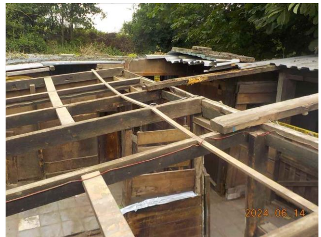
F16: Locatie gesaneerde toepassing.