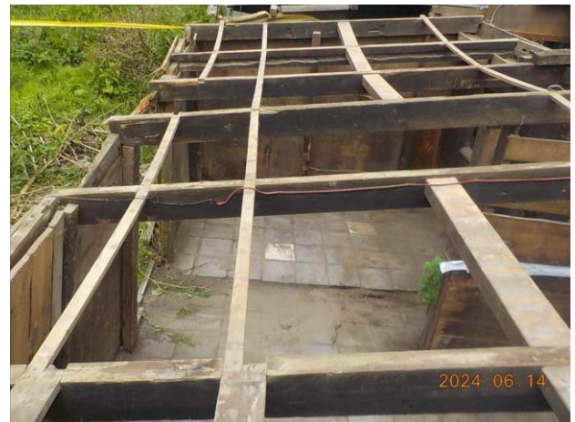
F14: Locatie gesaneerde toepassing.