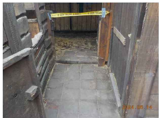
F12: Overzicht vloer.