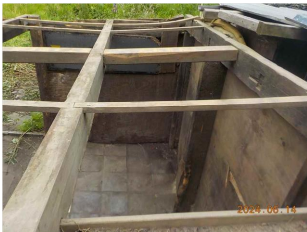
F17: Locatie gesaneerde toepassing.