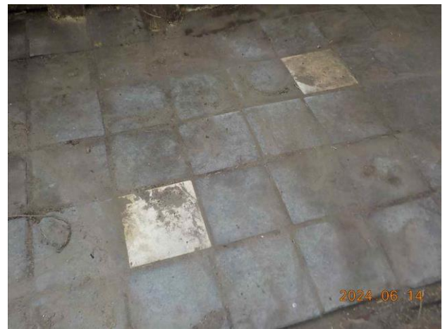
F10: Overzicht vloer.