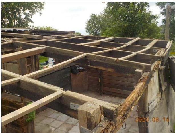
F9: Locatie gesaneerde toepassing.