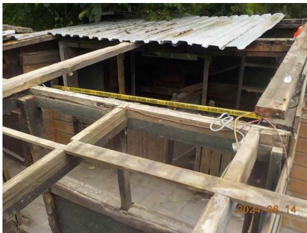
F15: Locatie gesaneerde toepassing.