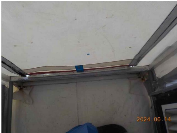
F19: Vuile ruimte.

Datum : 14-6-2024 Ref. opdrachtgever : 2024-1275 Plaats : Leidschendam