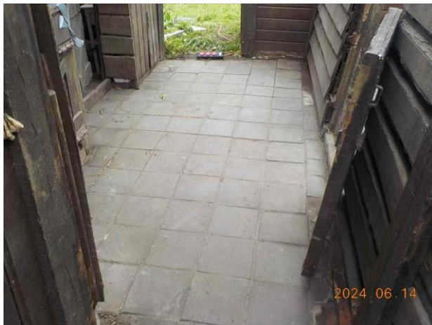
F13: Overzicht vloer.