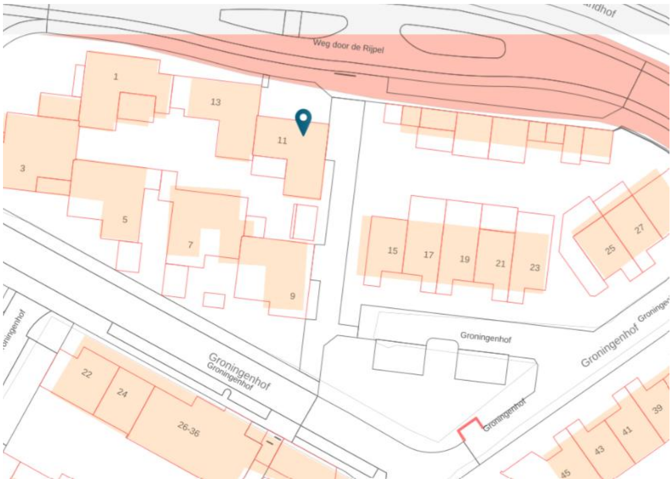
BIJLAGE BIJ VKB 25106 GPP Groningenhof 11, 5709 CC Helmond.