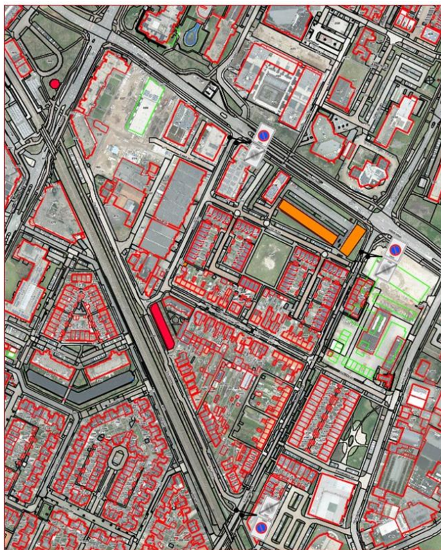
Behoort bij verkeersbesluit 20250801001