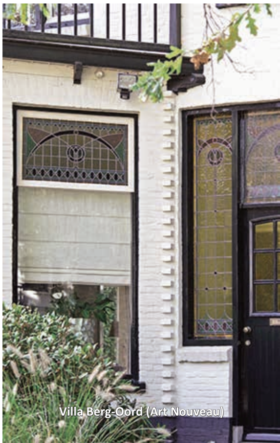
Villa Berg-Oord (Art Nouveau)