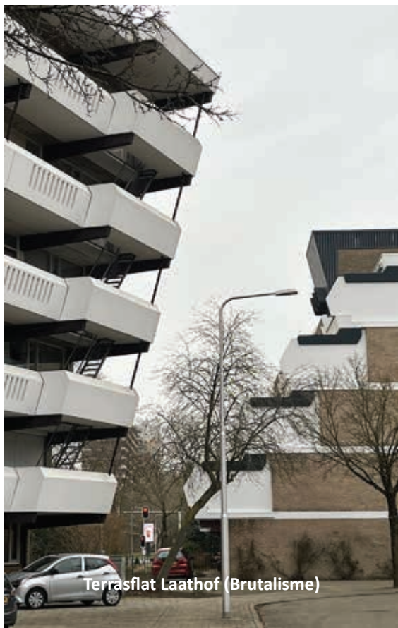
Terrasflat Laathof (Brutalisme)