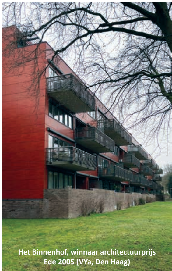
Het Binnenhof, winnaar architectuurprijs Ede 2005 (VYa, Den Haag)