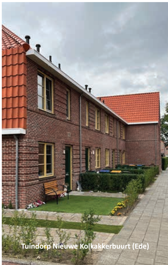
Tuindorp Nieuwe Kolkakkerbuurt (Ede)