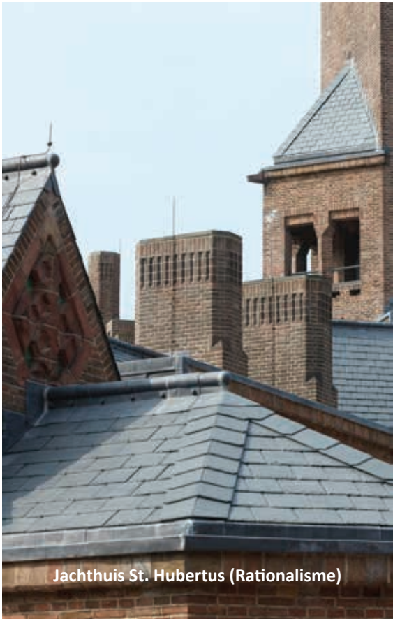
Jachthuis St. Hubertus (Rationalisme)