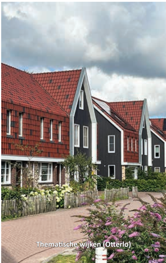
Thematische wijken (Otterlo)