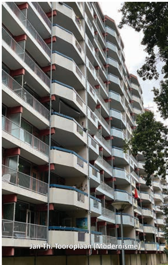
Jan Th. Tooroplaan (Modernisme)