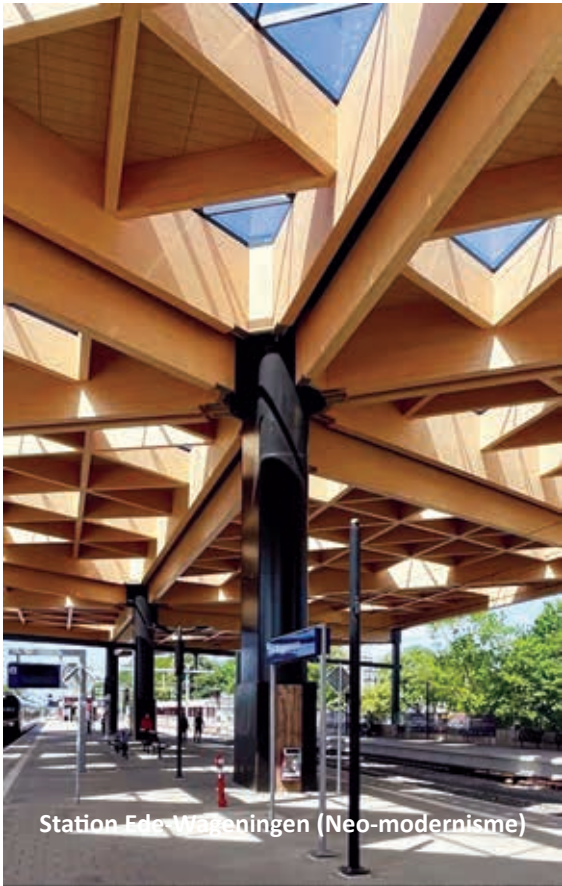
Station Ede-Wageningen (Neo-modernisme)