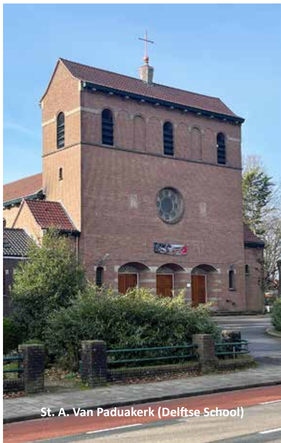
St. A. Van Paduakerk (Delftse School)