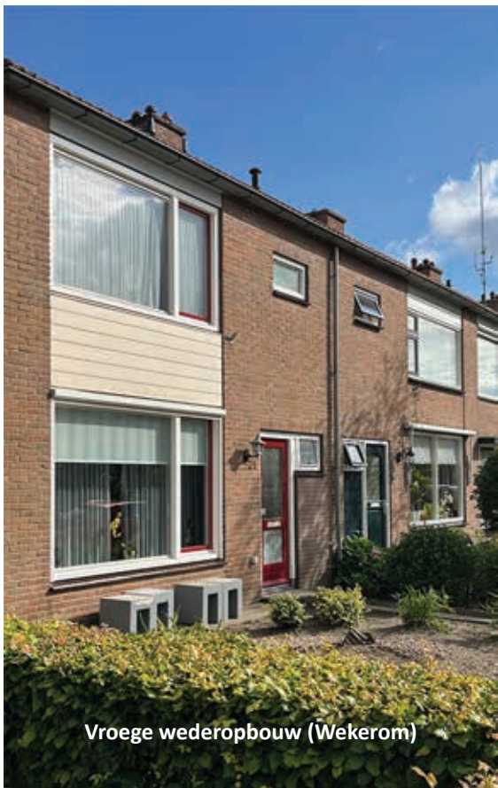
Vroege wederopbouw (Wekerom)