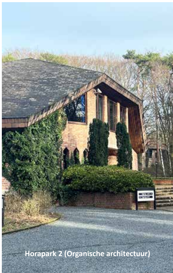
Horapark 2 (Organische architectuur)