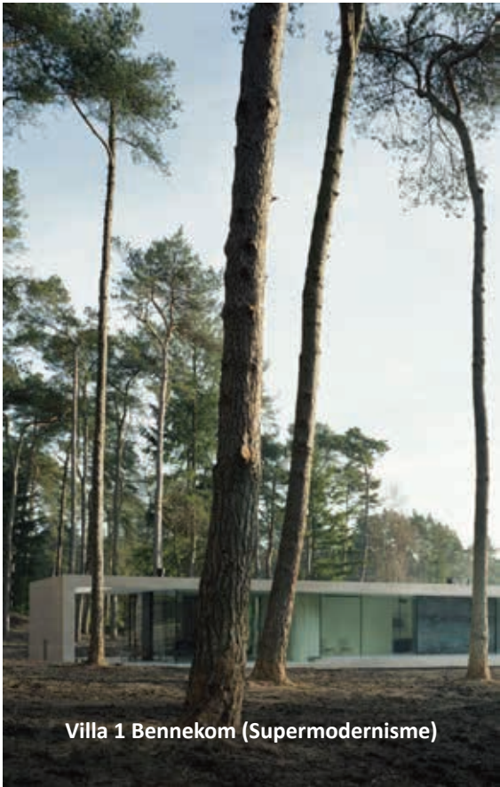
Villa 1 Bennekom (Supermodernisme)