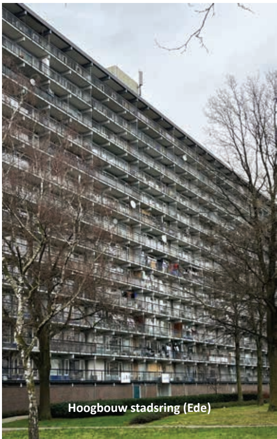
Hoogbouw stadsring (Ede)