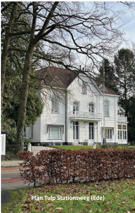
Plan Tulp Stationsweg (Ede)