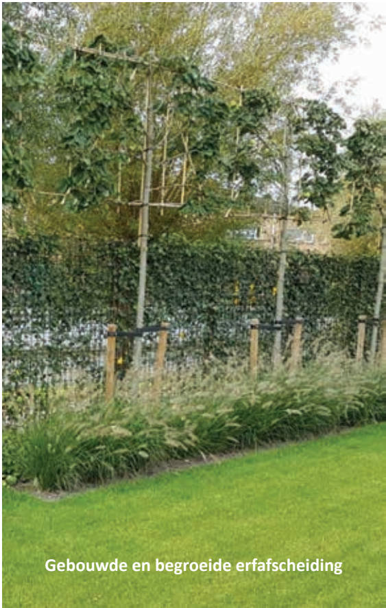
Gebouwde en begroeide erfafscheiding