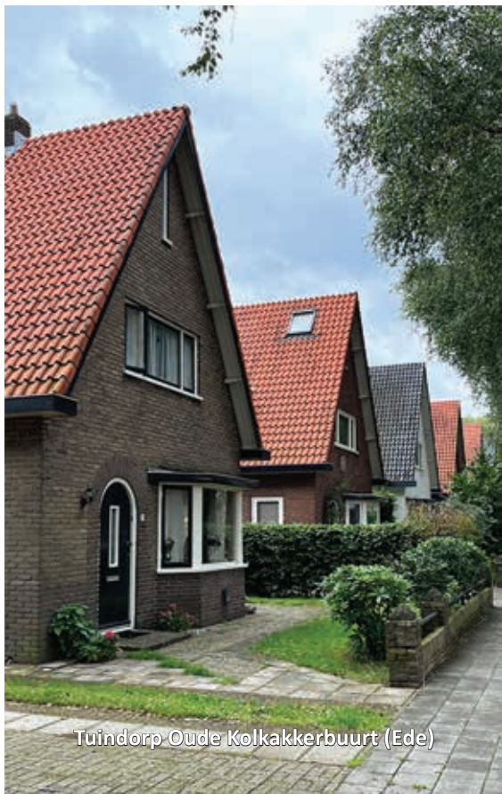
Tuindorp Oude Kolkakkerbuurt (Ede)