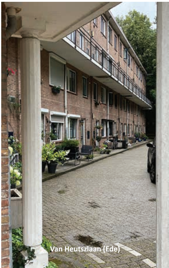
Van Heutszlaan (Ede)