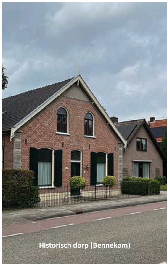
Historisch dorp (Bennekom)