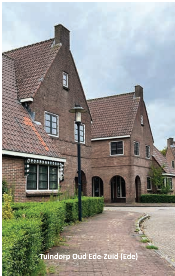
Tuindorp Oud Ede-Zuid (Ede)