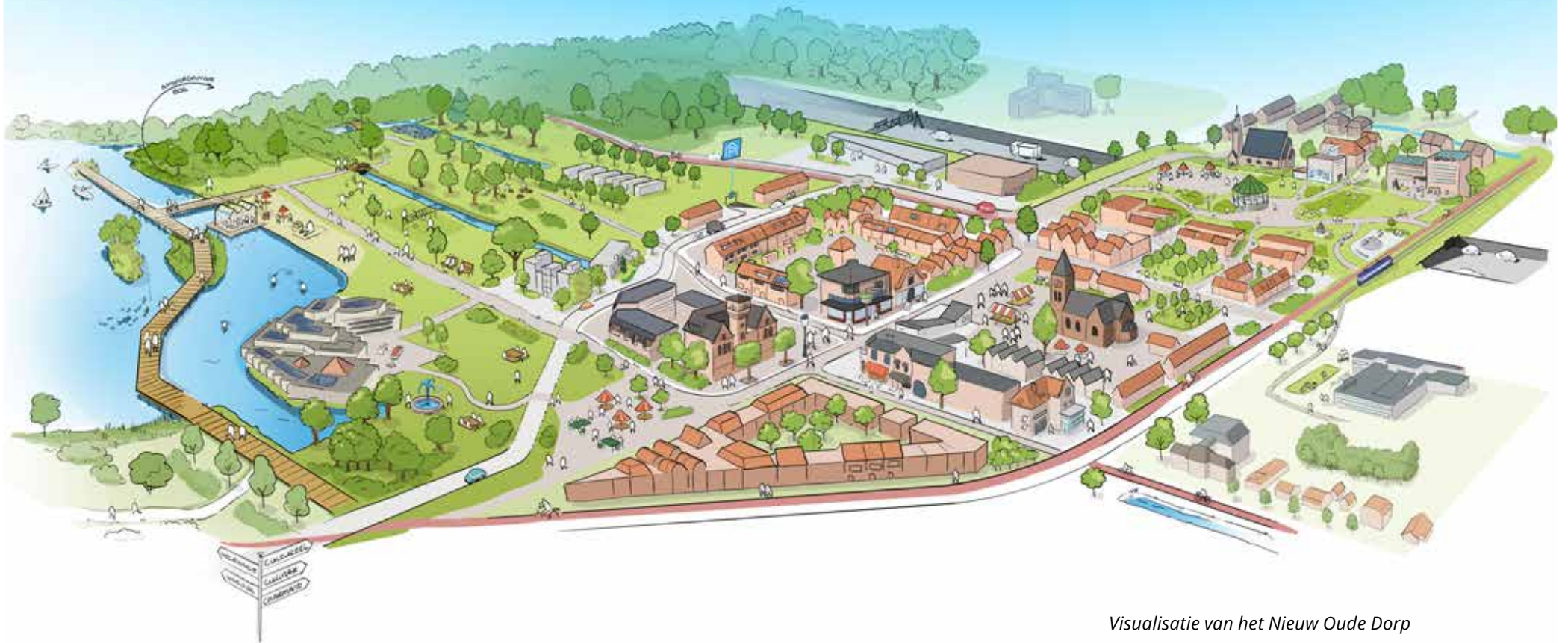
Visualisatie van het Nieuw Oude Dorp