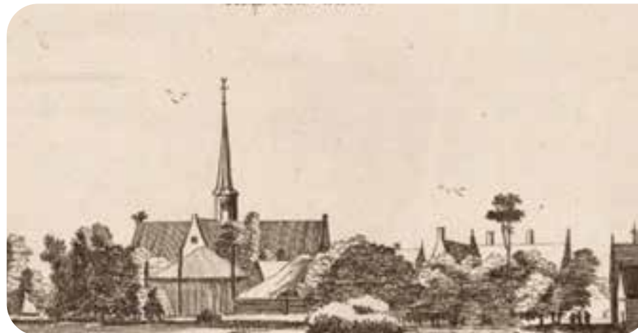
Gezicht op het dorp Amstelveen met de 16e-eeuwse kerk, 1650.

Hoofdstuk 1 beschrijft de aanleiding en in hoofdstuk 2 staan we stil bij de doelen en de ambitie. In hoofdstuk 3 worden de gebiedsafbakening, de ruimtelijke analyse en samenhang beschreven. Hoofdstuk 4 beschrijft uitgangspunten en maatregelen per deelontwikkeling. Hoofdstuk 5 gaat in op enkele beleidsthema's die van toepassing zijn en hoofdstuk 6 vormt de uitvoeringsstrategie.