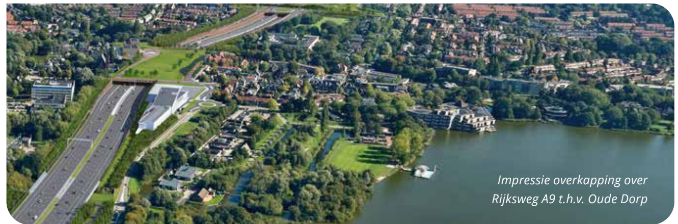
Impressie overkapping over Rijksweg A9 t.h.v. Oude Dorp

Door middel van gesprekken met ondernemers, bewoners en andere stakeholders in het gebied is er gekeken naar de huidige identiteit van het gebied en de kansen en ambities voor de toekomst. De rode draad is dat het Oude Dorp en omgeving een knusse plek is, met een fijne sfeer en historische bebouwing. Het Oude Dorp onderscheidt zich binnen Amstelveen door gezelligheid, het cultuuraanbod, elkaar opzoeken en in gesprek gaan. Máár dit gebeurt nog in beperkte mate: het Oude Dorp is klein, je loopt tegen de achterkant van bebouwing en heel veel parkeerplaatsen op maaiveldniveau aan. De routes van en naar de Poel en het Amsterdamse Bos zijn niet duidelijk en nauwelijks beleefbaar. Het Oude Dorp ligt 'afgekeerd' van het landschap. Er zijn programmatische verbeteringen en ingrepen nodig, hoewel het Oude Dorp de afgelopen jaren wel sterk verbeterd is.