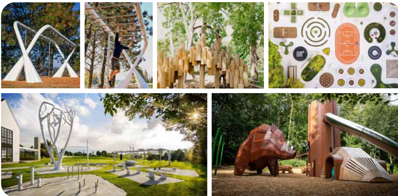
Referenties voor inrichting land-artpark