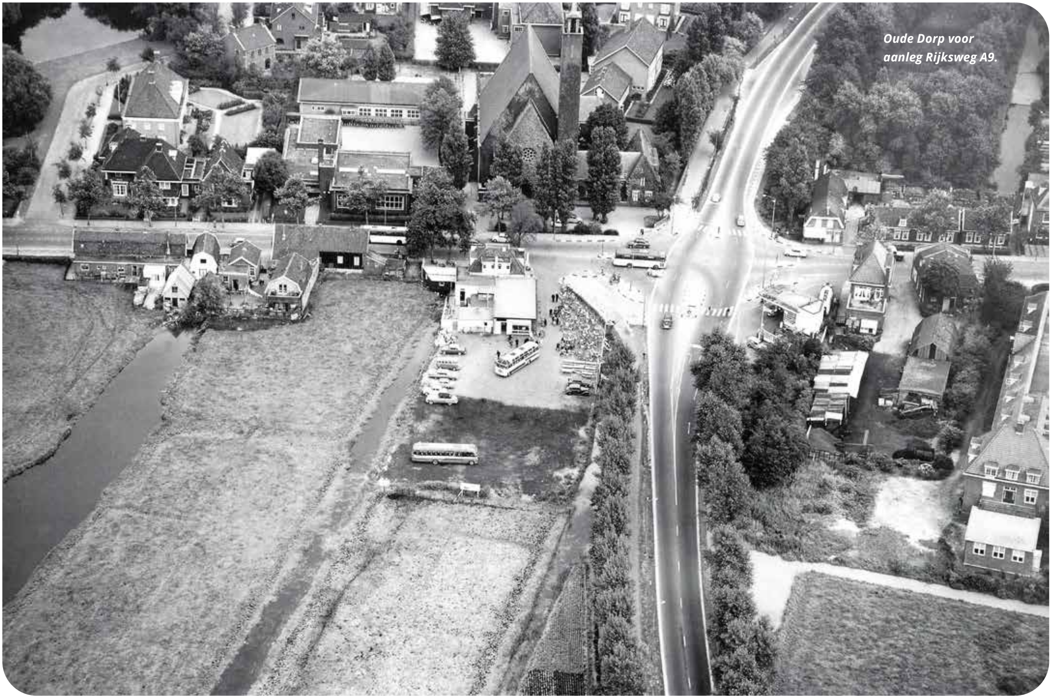
Oude Dorp voor aanleg Rijksweg A9.