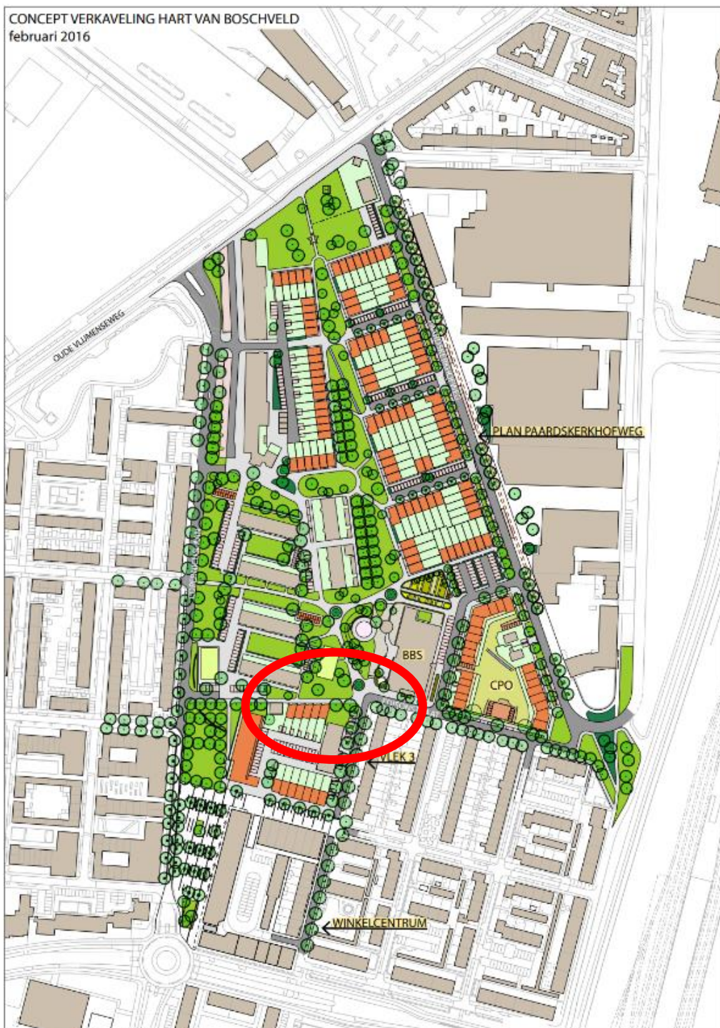
Afbeelding 2 Concept Verkaveling uit Ruimtelijk Functioneel Kader Hart van Boschveld 2016 blz. 48