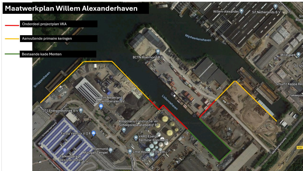
Figuur 2: Overzicht aanvullende primaire keringen in de Willem Alexanderhaven.

De aanvullende primaire kering waar onderhavig participatieplan betrekking op heeft is weergegeven in figuur 2. Door de realisatie van deze aanvullende kering wordt de algehele veiligheid in de haven verbeterd, alsook een positief effect wordt gerealiseerd op de waterkwaliteit in de Willem Alexanderhaven. Deze maatregel leidt ertoe dat hoogwater wordt afgeweerd en verontreinigingen afkomstig van de bedrijfsterreinen het water niet kunnen bereiken.