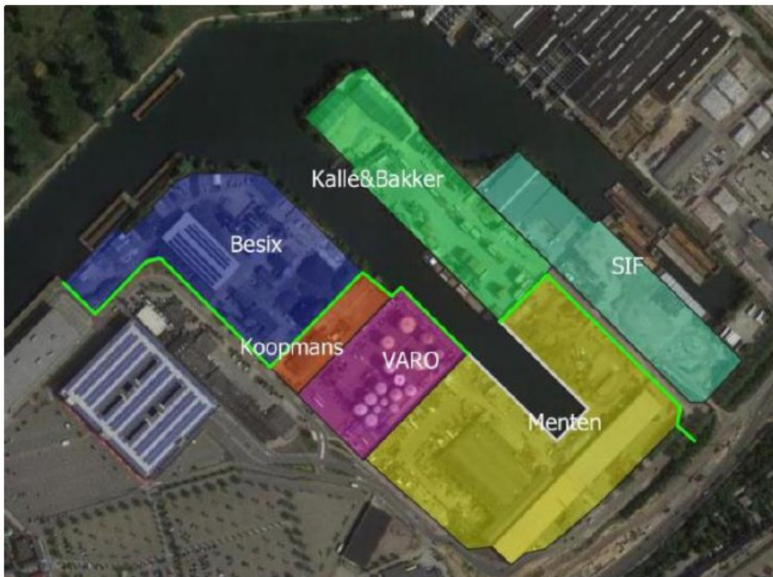
Figuur 1: Overzichtskaart voorkeursalternatief (groene lijn) en bedrijven

Aangezien bij de uitvoering van het gekozen voorkeursalternatief bepaalde delen van het havengebied buiten de dijken vallen, wat leidt tot waterkwaliteits- en -veiligheidsissues, werd het aanbrengen van aanvullende primaire keringen in de Willem Alexanderhaven onderzocht.