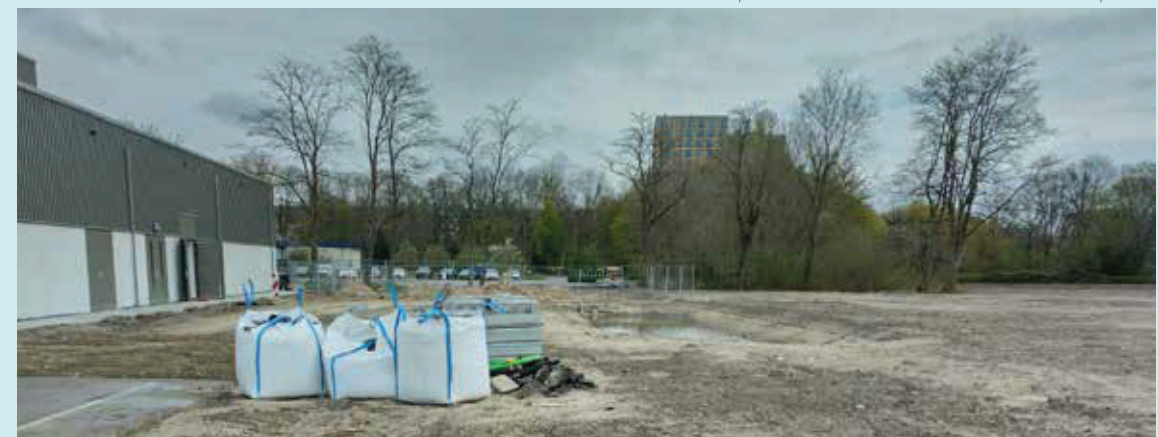
afb. 19: boomsingel uit het vernieuwingsplan RWZI en de toekomstige locatie (www.haverdroeze.nl)