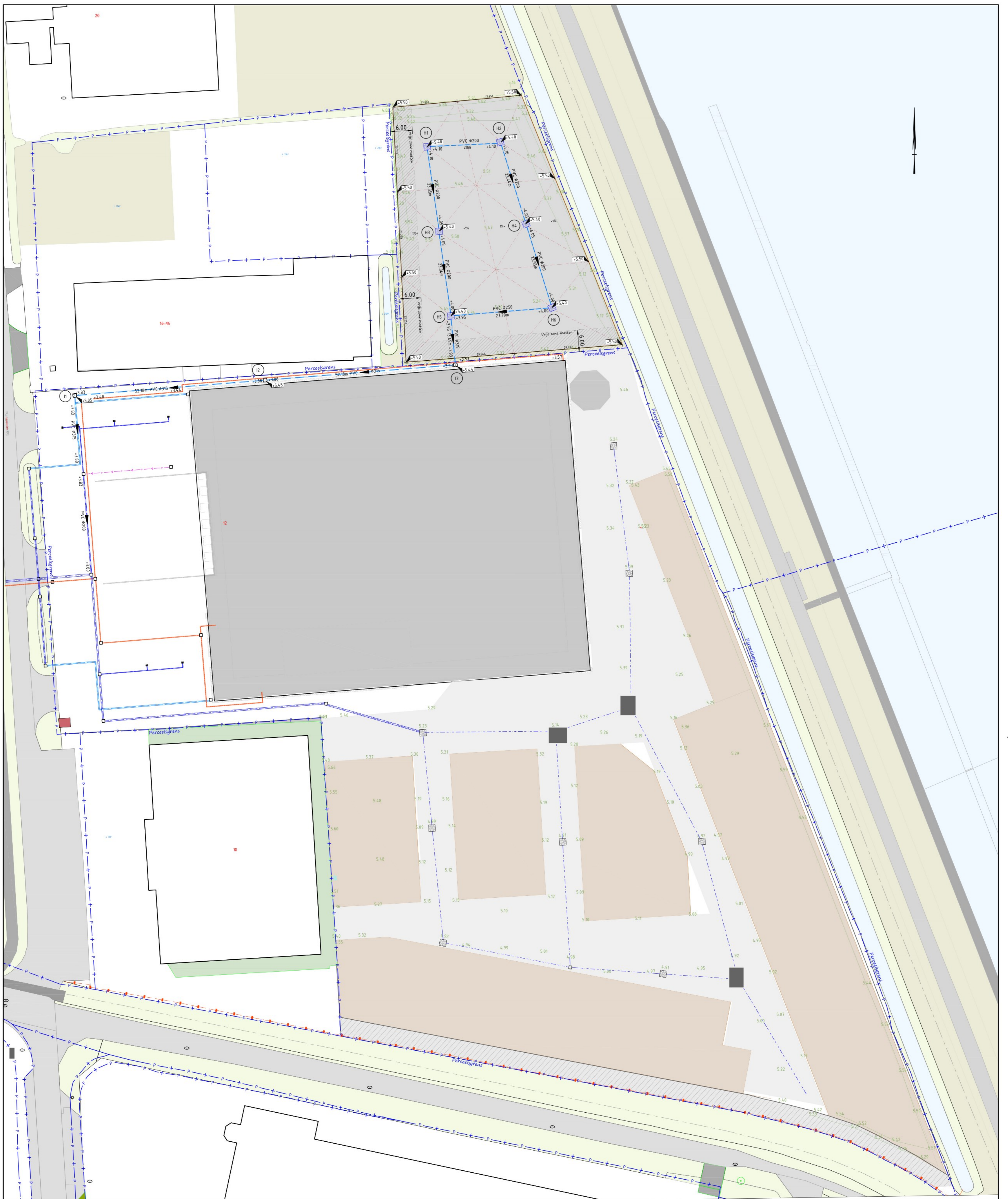
Overzicht situatie Schaal 1:500