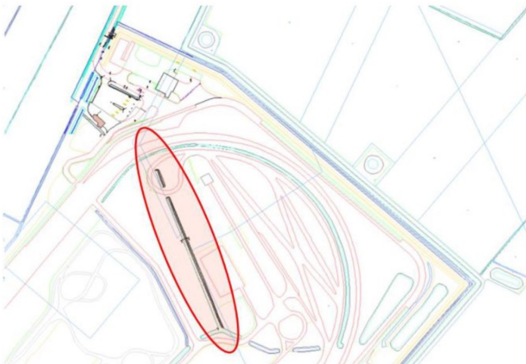
Figuur 6: Locatie verruiming greppel binnenterrein testbaan