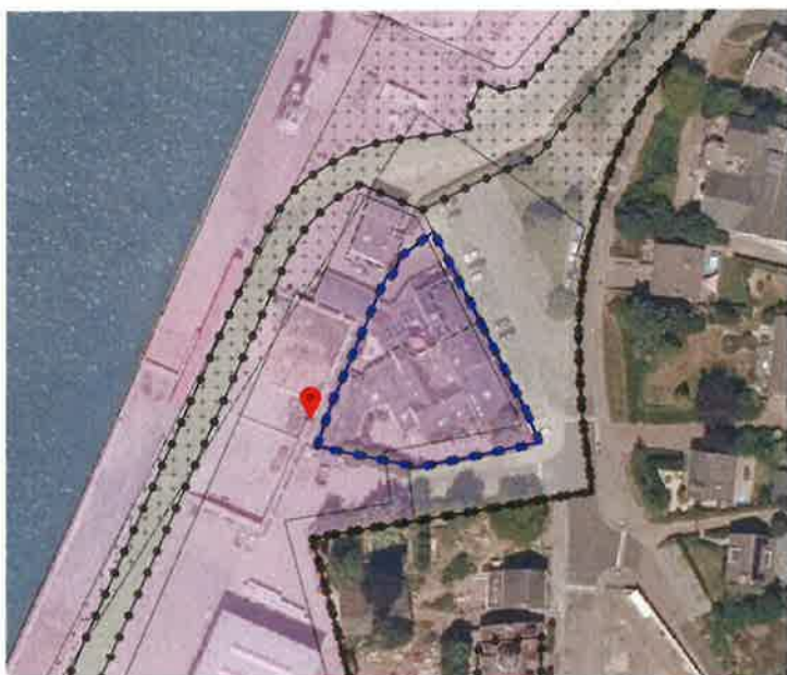
Locatie geluidscherm bovenop stapelblokkenwand

Ad. i. geluidscherm op/tegen een bestaande stapelblokkenwand op terreindeel 1