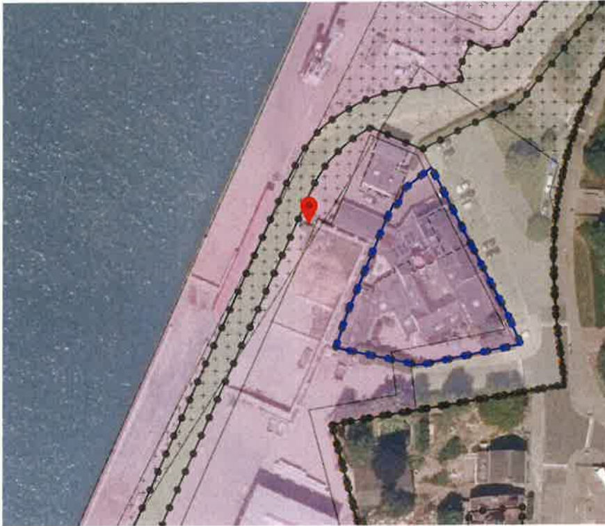
Locatie: stapelblokkenwanden (keerwanden), bulkopslag 2

Onder verwijzing naar onder meer de toelichting op de aanvulling aanvraag omgevingsvergunning bekend onder de rapportage van Volantis met documentnummer 20201180-R01, de dato 29 september 2020 versie: A, status: definitief, blijkt dat een stapelblokkenwanden (keerwanden) voor bulkopslag 2 wordt gelegaliseerd. Deze stapelblokkenwand heeft verder een tweeledige functie, te weten een geluidafschermdende maatregel. De bouwhoogte van deze stapelblokkenwanden bedraagt ten hoogste 4 meter ten opzichte van het aansluitende terrein, daarmee geen rekening houdend met het geluidscherm dat tegen de 'rug' (achterwand) van keerwand wordt gemonteerd.