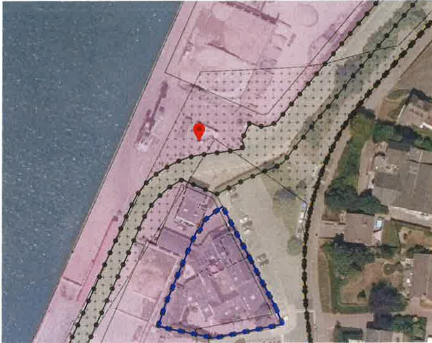
Locatie: reclamemast

Onder verwijzing naar onder meer de toelichting op de aanvulling aanvraag omgevingsvergunning bekend onder de rapportage van Volantis met documentnummer 20201180-R01, de dato 29 september 2020 versie: A, status: definitief, blijkt dat de reclamezuil wordt gelegaliseerd. De bouwhoogte van deze reclamezuil bedraagt 7,2 meter ten opzichte van het aansluitende terrein.