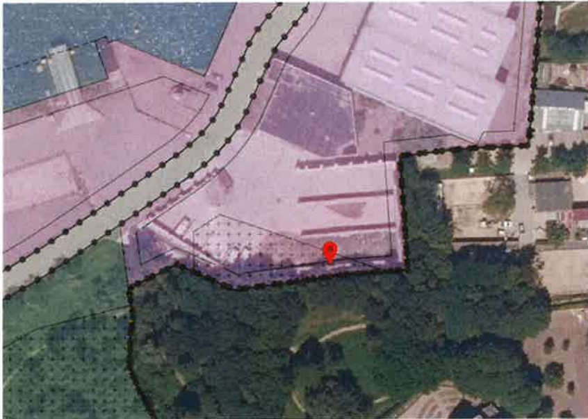
Locatie: stapelblokkenwanden (keerwanden), bulkopslag 1

Onder verwijzing naar onder meer de toelichting op de aanvulling aanvraag omgevingsvergunning bekend onder de rapportage van Volantis met documentnummer 20201180-R01, de dato 29 september 2020 versie: A, status: definitief, blijkt dat een stapelblokkenwanden (keerwanden) voor bulkopslag 1 wordt gelegaliseerd. Deze stapelblokkenwand heeft verder een tweeledige functie, te weten een