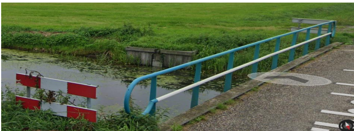
Figuur 2: Inlaat 524 'Kibbelslaginlaat'.