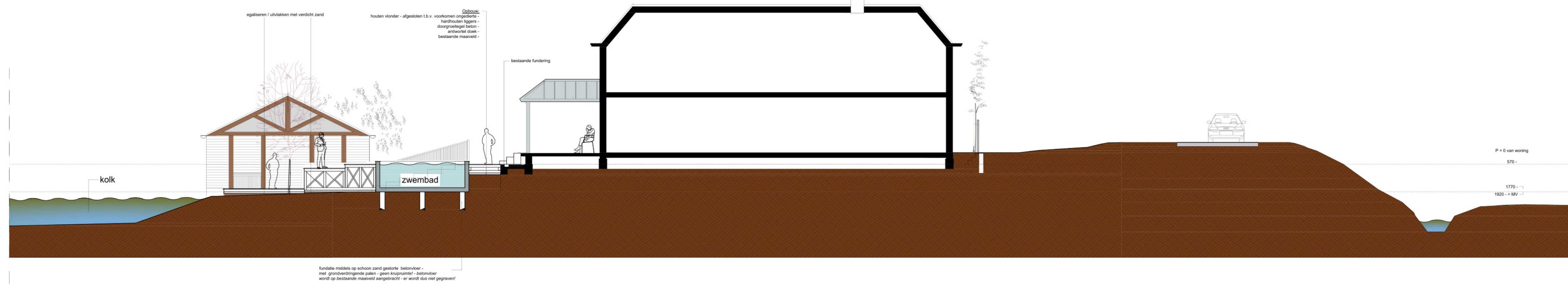
Doorsnede B-B gewijzigd

Verklaring vlonder rondom zwembijver - de hardhouten palen van de vlonder worden op liggers aangebracht die op het maaiveld liggen - deze palen gaan dus niet de grond in - waar nodig om (vlakke horizontale ondergrond te verkrijgen) wordt er verdicht zand aangebracht om zo de hardhouten liggers weleens te kunnen leggen - op deze liggers komen de palen te staan en vervolgens de bovenliggers en het vlonder zelf.