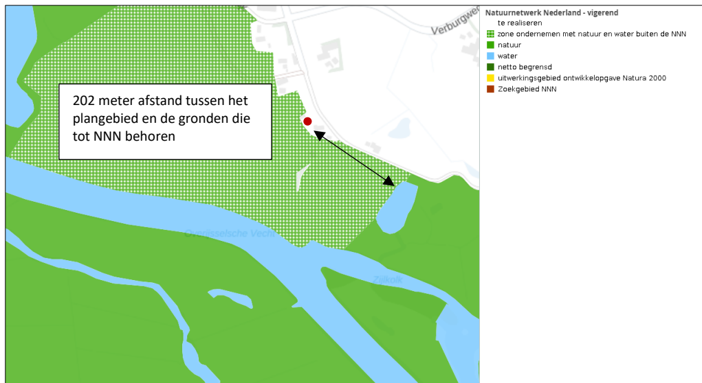
Ligging van Natuurnetwerk Nederland in de omgeving van het plangebied. De ligging van het plangebied wordt met de rode marker aangeduid. Gronden die tot Natuurnetwerk Nederland behoren worden met de groene en blauwe kleur op de kaart aangeduid.