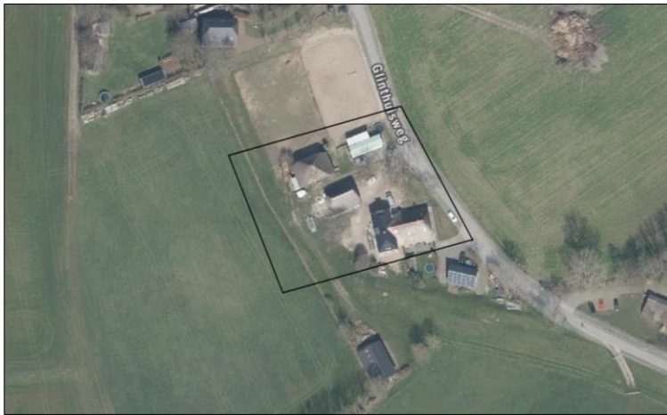
Verspreiding van alle bekende records in het plangebied (bron: NDFF).

Op 8 juni 2023 is de NDFF geraadpleegd en is gekeken of waarnemingen van beschermde planten en dieren aanwezig zijn in de databank. Er zijn geen waarnemingen vastgesteld in het plangebied en in de directe omgeving van het plangebied.