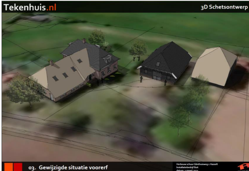
Verbeelding van het wenselijke eindbeeld

Het voornemen bestaat de schuur te slopen en hier een nieuw bijgebouw voor in de plaats te bouwen. Er wordt geen beplanting geroid. Op onderstaande afbeelding wordt een verbeelding van het wenselijke eindbeeld weergegeven.