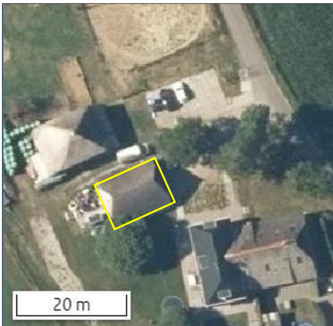
Begrenzing van het plangebied; deze wordt met de gele lijn aangeduid.

Het plangebied bestaat uit een schuur. Deze schuur is gebouwd van hout en beschikt over een rieten dakbedekking. Rondom de dakrand en bij een opening in de nok van de schuur is kippen gaas aangebracht. Rondom de schuur ligt gazon en erfverharding. Er is geen opgaande beplanting of open water aanwezig in het plangebied. Het plangebied wordt omgeven door bebouwd erf en agrarisch grasland. Op onderstaande afbeelding wordt de begrenzing van het plangebied weergegeven. Voor een verbeelding van de huidige situatie wordt verwezen naar de fotobijlage.