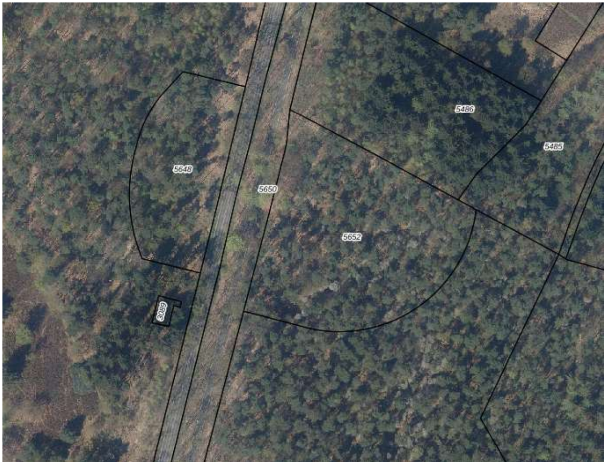
Afbeelding 1: Luchtfoto van de vellingslocatie in 2016

Onderstaand de zijn de velling en compensatielocatie weergegeven die behorende bij het besluit van Gedeputeerde Staten van Utrecht van 1 februari 2024, met zaaknummer Z2022-00000985.