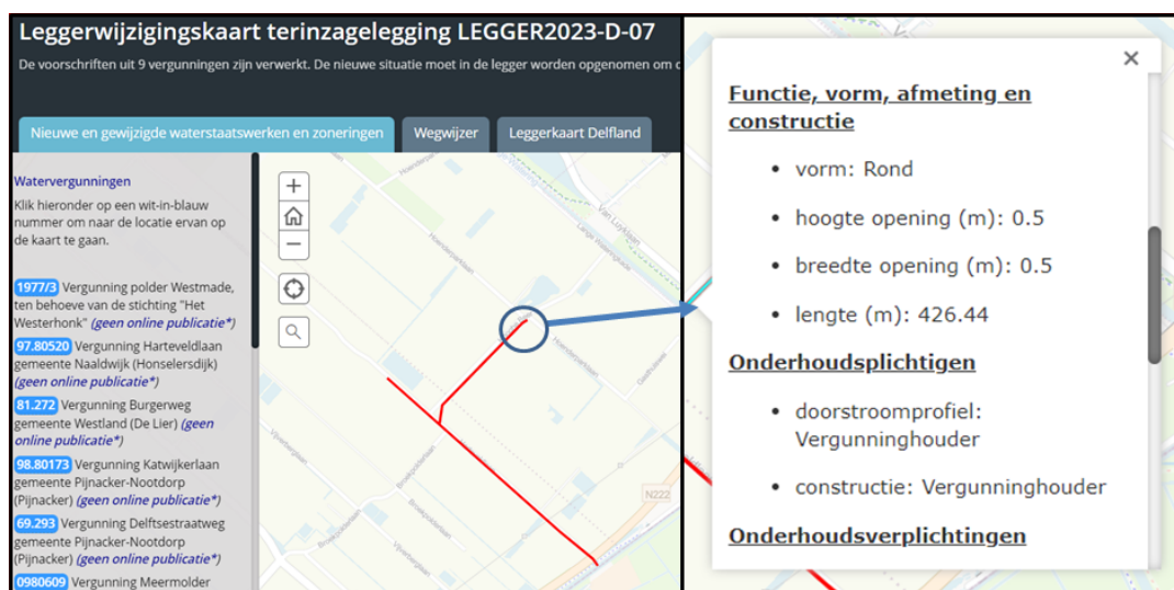
Figuur 1: Voorbeeldweergave van de interactieve leggerwijzigingskaart

Een voorbeeld van de werking van de leggerwijzigingskaart is weergegeven in Figuur 1.