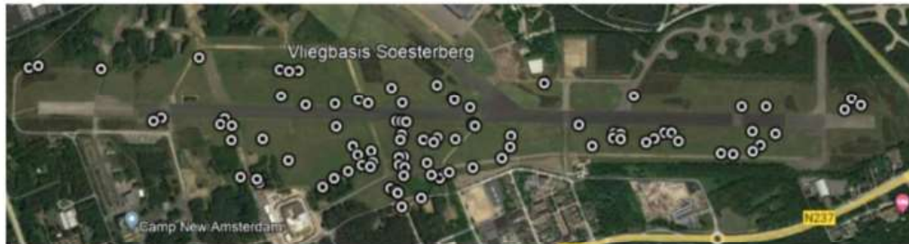
Figuur 3 Verspreiding van de kommavlinder langs de hoofdlandingsbaan op 2 augustus 2022.

Afbeelding 1.5 resultaten van onderzoek naar kommavlinder in 2022 (EIS, 2022)