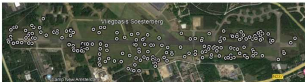
Figuur 4 Verspreiding van de kommavlinder langs de hoofdlandingsbaan op 10 augustus 2022.