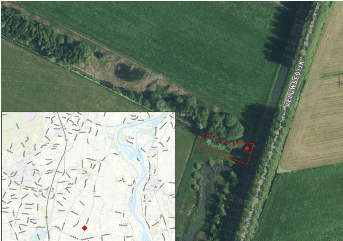
Figuur 1. De ligging van het projectgebied (rood omlijnd) inclusief de locatie van het huidige gemaal (rode ruit).