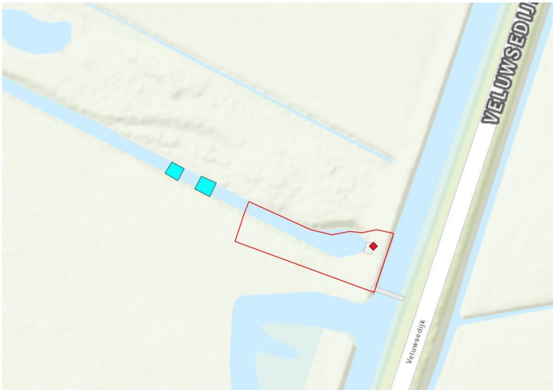
Figuur 3. Locaties waar de verdiepte delen (lichtblauwe vlakken) in de Emsterbroek worden aangelegd met de locaties van het huidige gemaal (rode ruit).