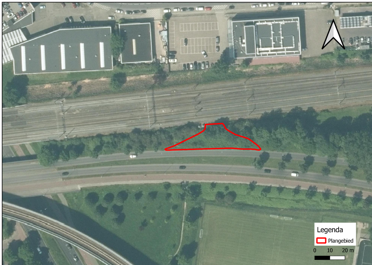
Figuur 1.2. Gedetailleerde ligging van het plangebied (rood omkaderd). Kaart gemaakt in QGIS.