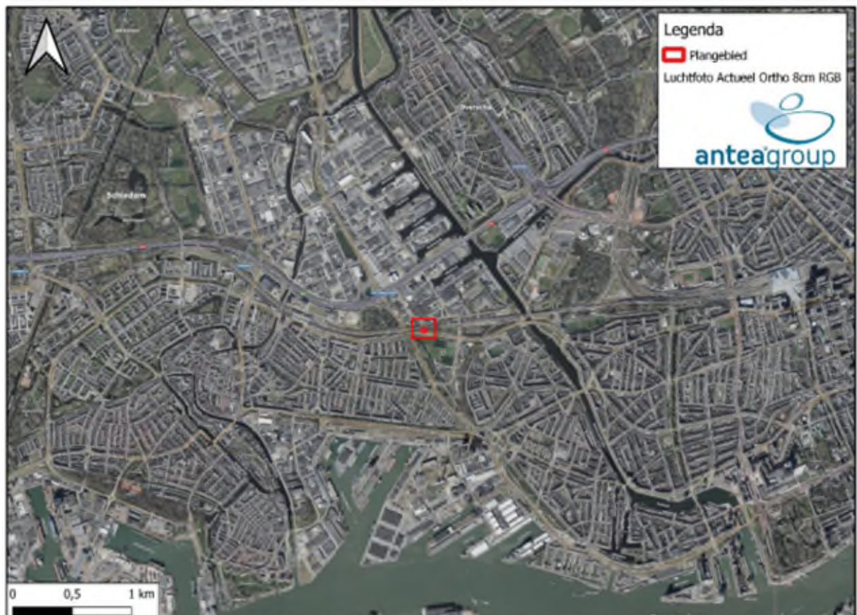
Figuur 1.1. Globale ligging van het plangebied (rood omkaderd) ten opzichte van de omgeving. Kaart gemaakt met QGIS.

In de figuren 1.1 en 1.2 is de ligging van het plangebied weergegeven.