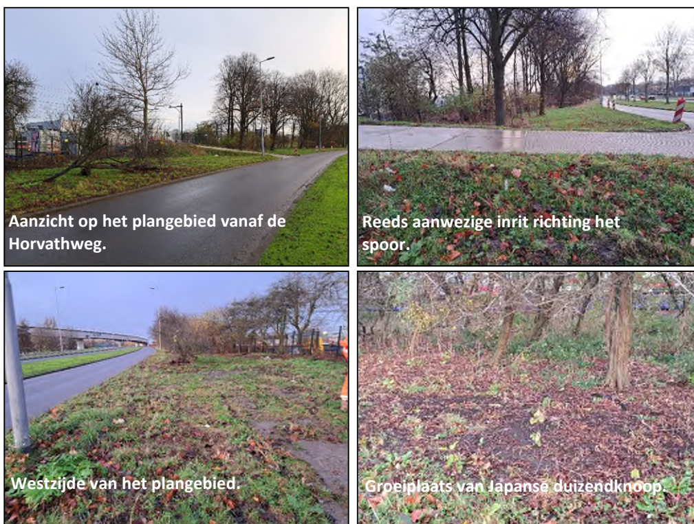
Figuur 2.1. Impressie van het plangebied.

In figuur 2.1 is een impressie gegeven van het plangebied.