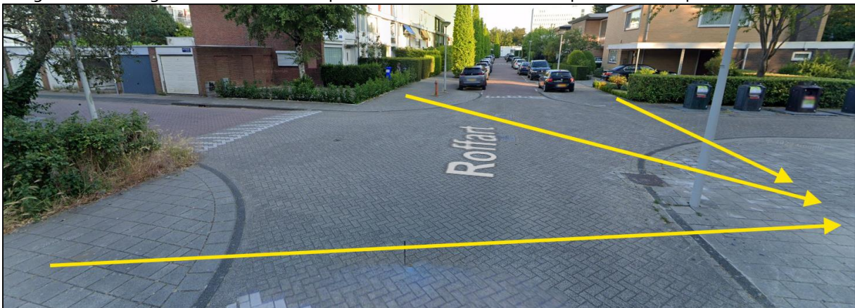
Foto 2.: Overzichtsschets van de hoeken waarvandaan kan worden overgestoken

Vanaf elke hoek is tegemoetkomend verkeer goed zichtbaar. Hiervandaan kan door ouders met kinderen veilig worden overgestoken naar de stoep aan de overkant die doorloopt tot aan de speeltuin.