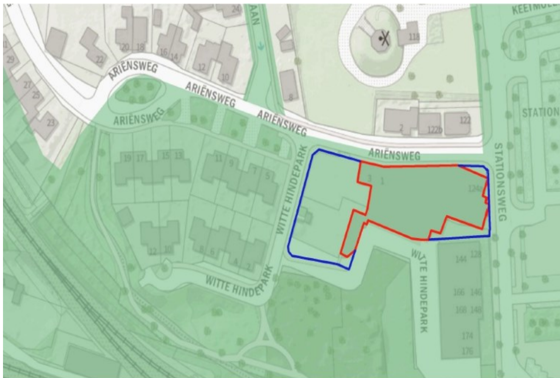
Figuur 1: Omkadering van het plangebied (blauw kader) met de te slopen bebouwing (rood kader).