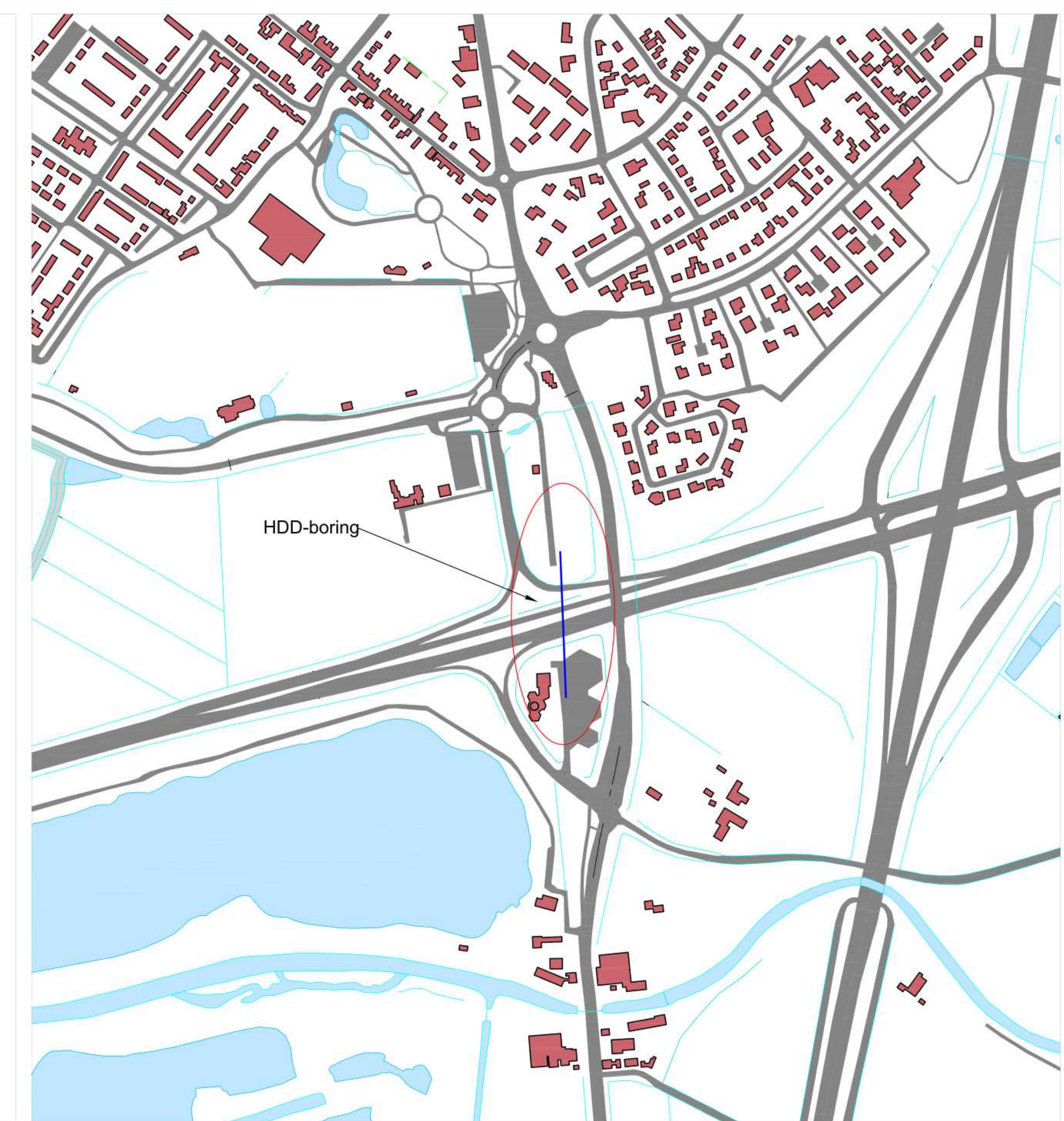
Situatieschets (schaal 1:4000)