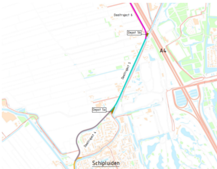
Afbeelding 1: Ligging stremming (aangegeven als Deeltraject 5)

De werkzaamheden voor het aanbrengen van de damwanden worden vanaf een ponton uitgevoerd, welke nagenoeg de gehele vaarweg blokkeert. Het is niet mogelijk om tijdens de werkzaamheden het vaarverkeer deze werkzaamheden veilig en vlot te laten passeren. Om deze reden is het noodzakelijk dit gedeelte van De Gaag geheel te stremmen voor al het vaarverkeer.