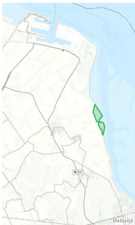
Figuur 1: groen = locatie dubbele dijk gebied

Het dagelijks bestuur van het waterschap Noorderzijlvest heeft op 13 september 2024 van een aanvraag ontvangen om een omgevings-vergunning als bedoeld in artikel 5.1, tweede lid, van de Omgevingswet (Ow). De aanvraag betreft een aantal activiteiten de volgende activiteiten in het dubbele dijk gebied bij Bierum, waarvan de locatie hieronder globaal is weergegeven in figuur 1.