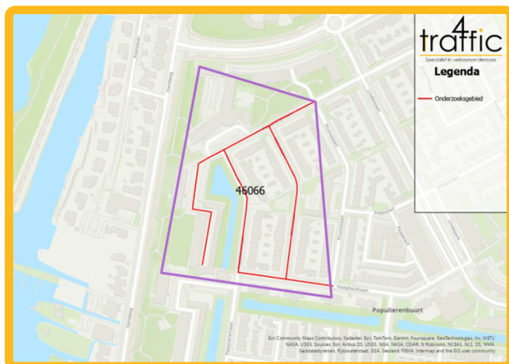
Afbeelding 3. Onderzoeksgebied Keizer Karelpark west oostzijde

4-Traffic heeft voor dit onderzoeksgebied een gebiedsomvang van 46066 m 2 gehanteerd.