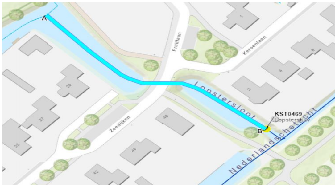
Figuur 1: Locatie van de te vervangen stuw KST0469, met tussen 'A en B' de af te stoten hoofdwatgang.

Het dagelijks bestuur van het waterschap Noorderzijlvest heeft op 26 juni 2024 van namens een aanvraag ontvangen om een omgevingsvergunning als bedoeld in artikel 5.1, tweede lid, van de Omgevingswet (Ow). De aanvraag betreft het verwijderen van een schotbalkenstuw en de aanleg van een nieuwe stuw in de primaire watergang Lopstersloot nabij Zeedijken te Loppersum, zoals hieronder globaal is weergegeven in figuur 1 en 2.