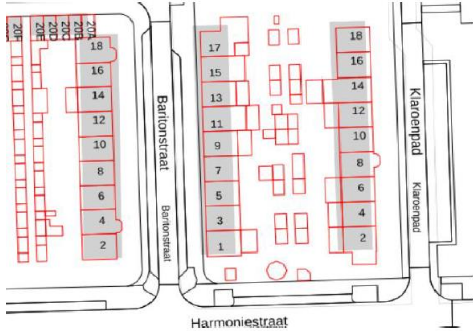
BIJLAGE BIJ VKB 24091 GPP Baritonstraat 18, 5702JM Helmond