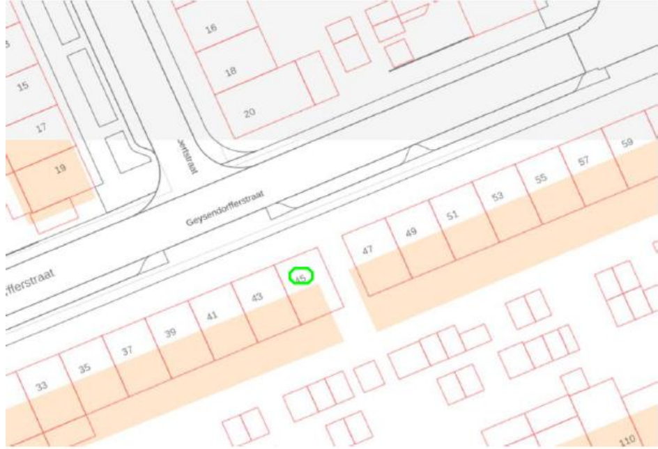
BIJLAGE BIJ VKB 24086 GPP Geysendorfferstraat 45, Helmond