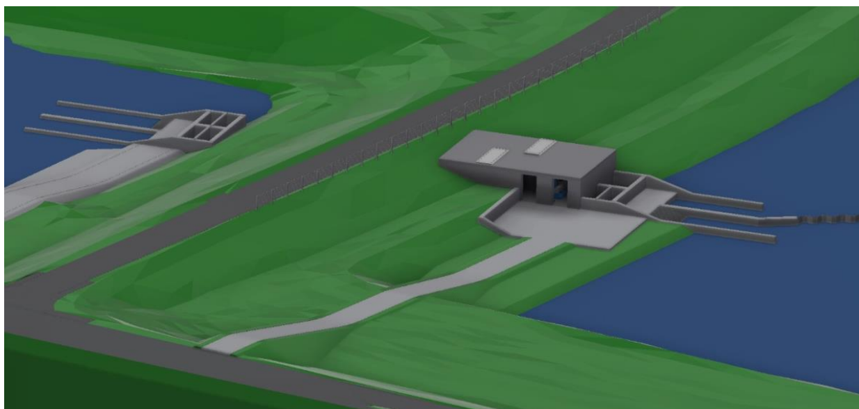
Figuur 2: 3D-impresie van de doorlaatduiker.