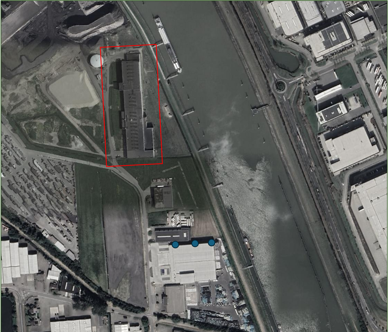
Figuur 1: locatie aan te brengen extra (tijdelijke) vloermuiskasten.

Het rode kader betreft het te slopen gebouw. De blauwe stippen geven de locatie van de 3 extra kasten weer.