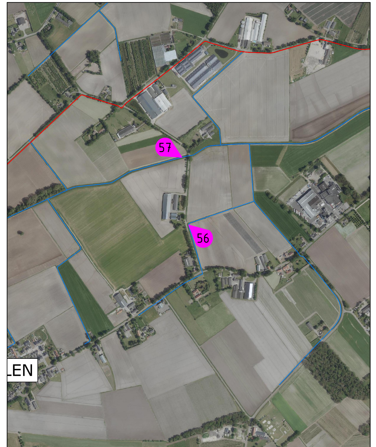
OVERZICHT Schaal 1:10.000