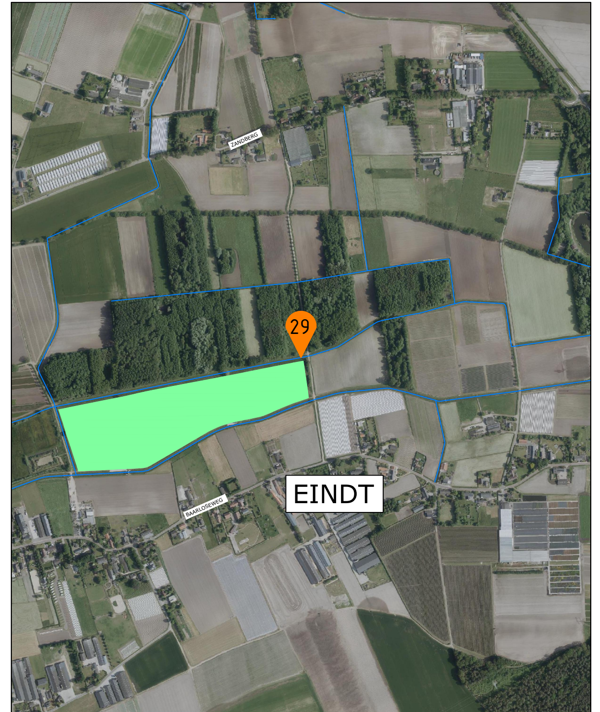
OVERZICHT Schaal 1:10.000