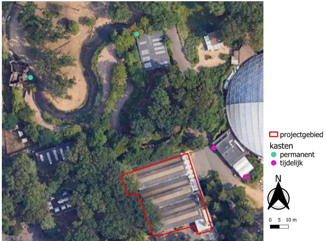
Figuur 4: De locaties van alternatieve voorzieningen voor grote gele kwikstaart. In het nieuwe gebouw worden ook nog voorzieningen gerealiseerd, mogelijk de twee kasten die als tijdelijk zijn opgehangen.