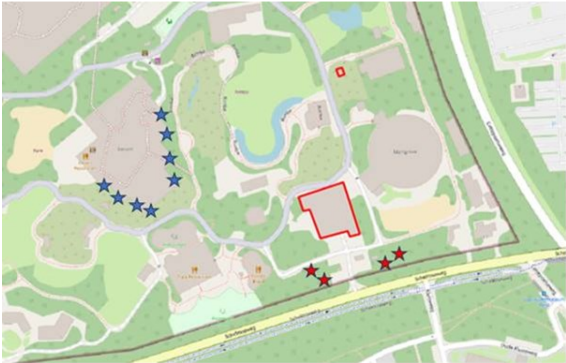
Figuur 3: Locaties van de tijdelijke mitigatie voor vleermuizen ten opzichte van het plangebied (rood omlijnd). De rode sterren zijn kasten aan bomen voor gewone grootoorvleermuis. De blauwe sterren zijn kasten aan het verblijf Dessert voor gewone dwergvleermuis.