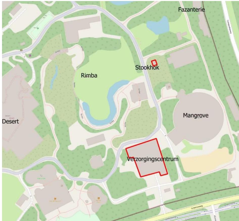
Figuur 2: De precieze locatie van het plangebied (rood omlijnd) binnen Burgers' Zoo.