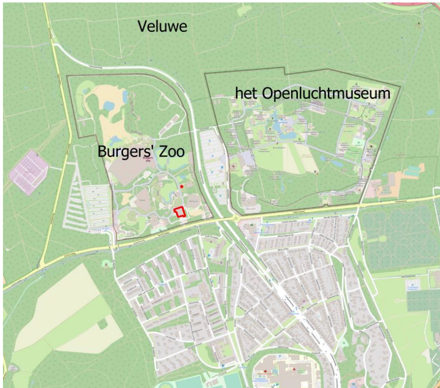
Figuur 1: Het plangebied (rood omlijnd) in de omgeving van Arnhem Noord.