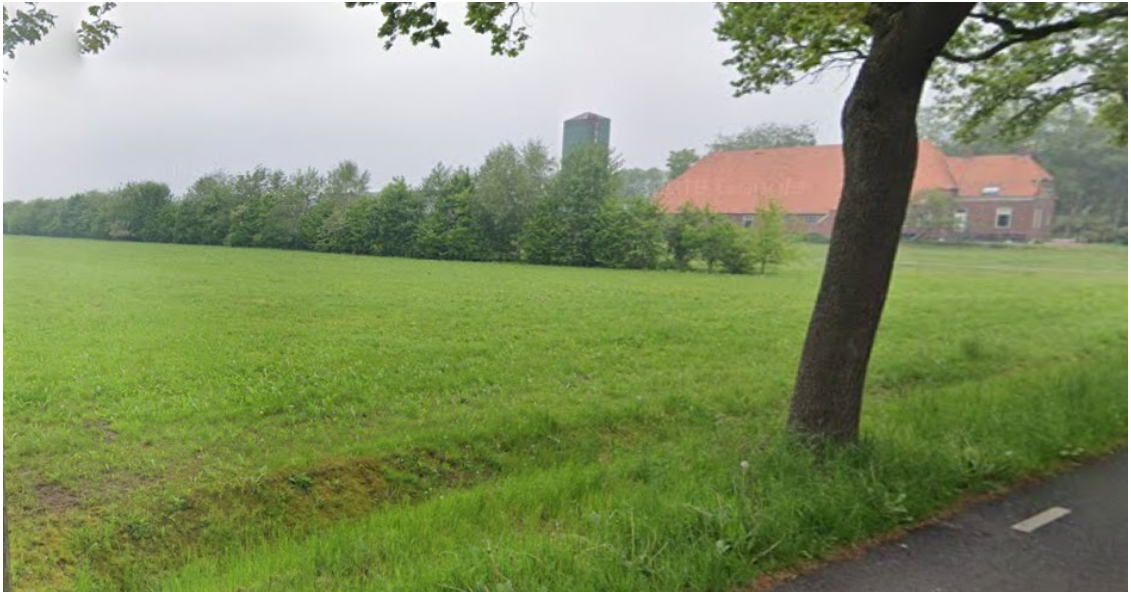
Figuur 2, foto groensingel bestaand