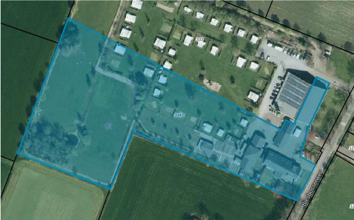
Perceel RWD01-G-334 (achterste gedeelte)