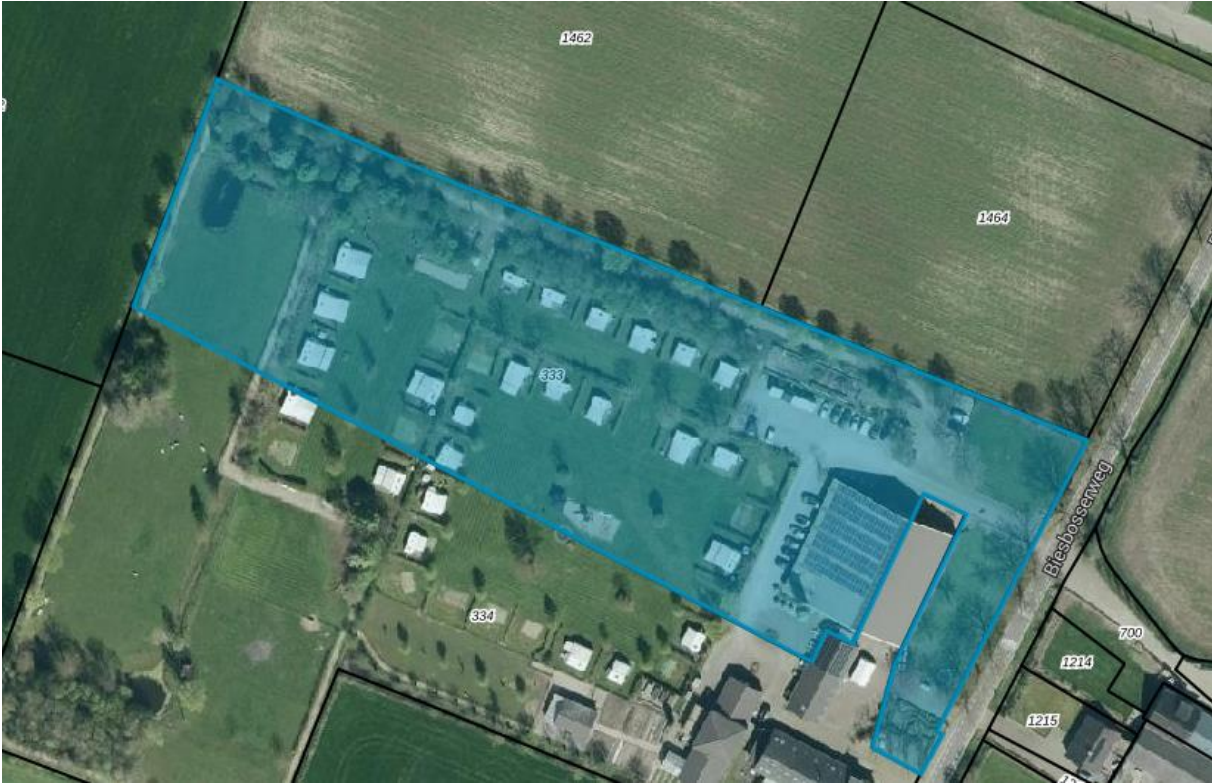
Perceel RWD01-G-333 (achterste gedeelte)