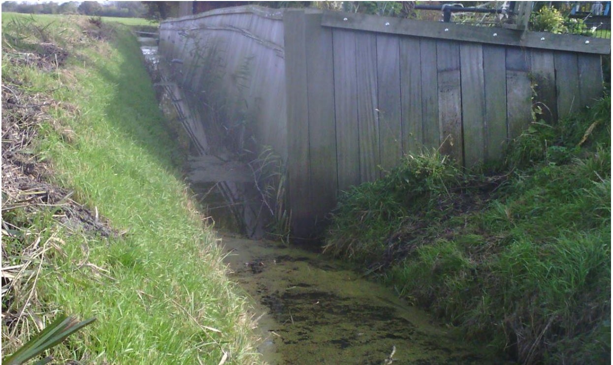
Figuur 1: Foto waterschap d.d. 14-10-24 aangelegd oeververdedigingswerk

De aanvraag betreft de reeds uitgevoerde aanleg (legalisatie) van een oeververdedigingswerk nabij Paddepoelsterweg 10 te Groningen, zoals hieronder globaal is weergegeven in figuur 1, 2 en 3.