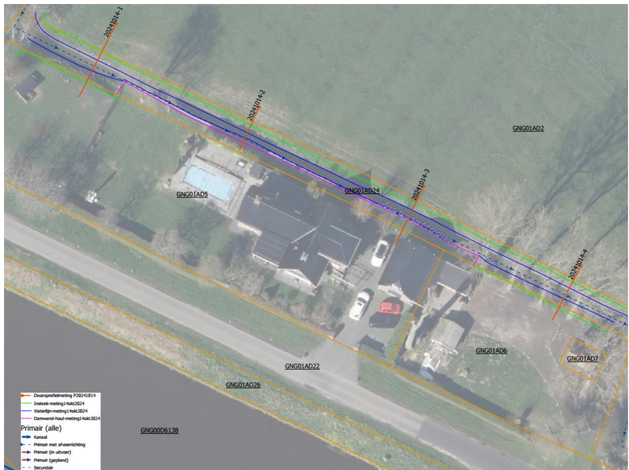
Figuur 3: Afbeelding met o.a. locaties gemeten dwarsprofielen, lijn beschoeiing (in roze) en kadastrale begrenzings bij locatiebezoek waterschap 14 oktober 2024.

De vergunningaanvraag is bij waterschap Noorderzijvest geregistreerd onder het zaaknummer Z/24/073765. De aanvraag omvat de volgende voor dit besluit relevante stukken: