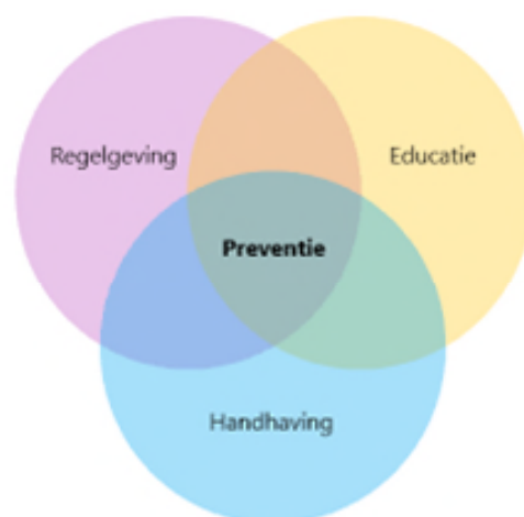
Figuur 1: Preventiemodel Reynolds

Dit preventie- en handhavingsplan alcohol is gebaseerd op deze integrale beleidsvisie. Er is immers sprake van een preventie- én handhavingsplan. Dat impliceert dat meerdere afdelingen binnen de gemeente - en dus ook meerdere typen maatregelen – worden betrokken dan wel ingezet worden bij de aanpak van alcoholproblematiek.