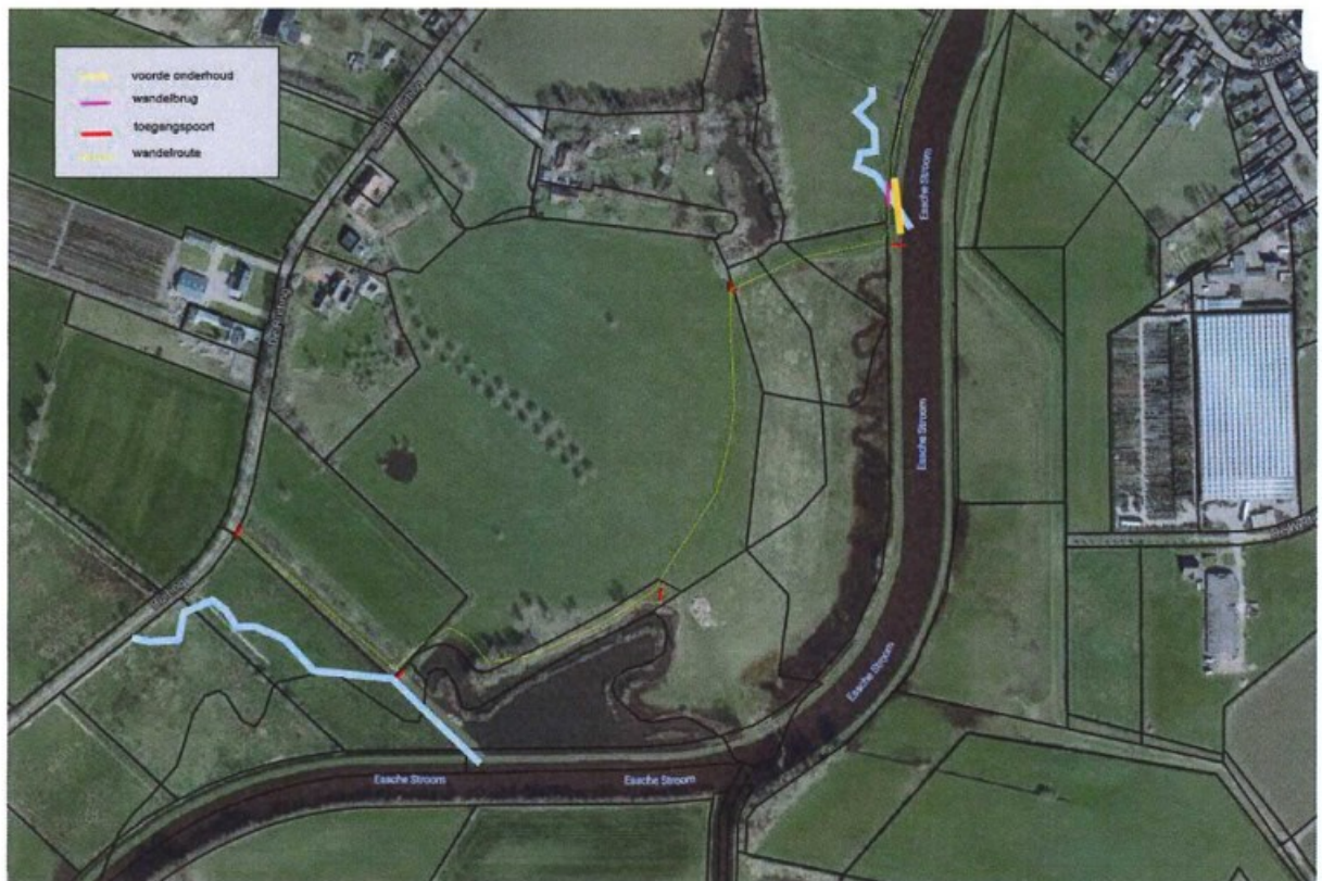
Figuur 2. Wandelroute (gele lijn)