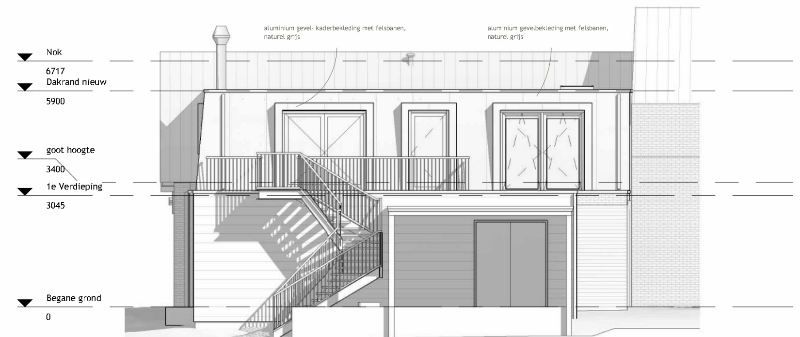
Achtergevel 1 : 100