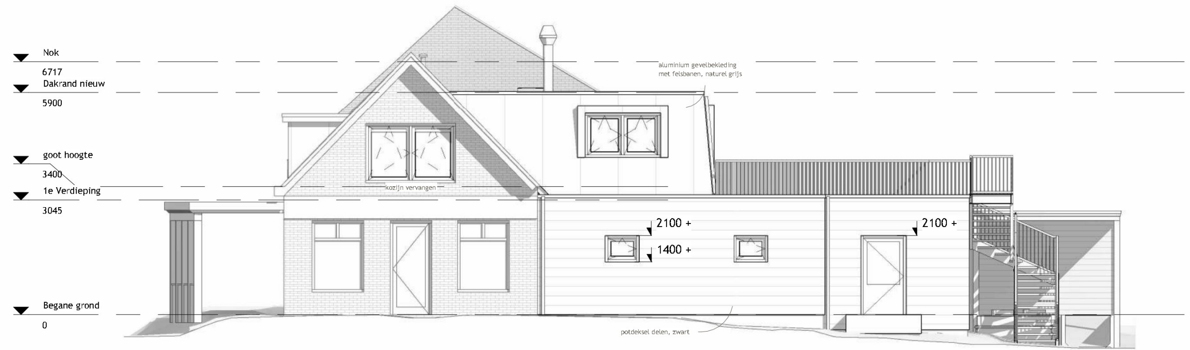
Rechter zijgevel 1 : 100