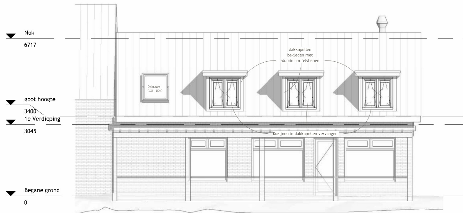
Voorgevel 1 : 100